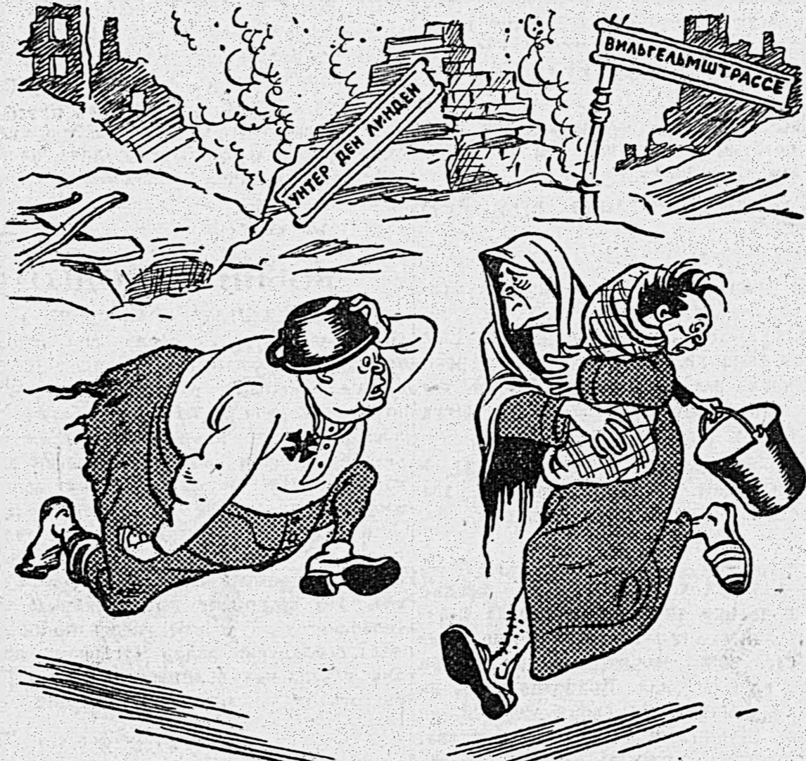
— Куда вы, Геринг??? — К вам в министерство иностранных дел. А вы, Риббентрон? — А мы с Геббельсом к вам в министерство авиации!!!