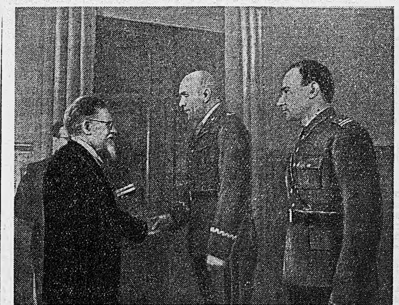
М. И. Калинин вручает орден Ленина генерал-майору З. М. Берлингу. Справа полковник В. М. Сокоорский.

НА ОСВОБОЖДЕННОЙ КУРСКОЙ ЗЕМЛЕ. — З. Хирен. — Оживающий город. * Виктор Финк. — Священный труд (3 стр.). Гвардии старший лейтенант И. Намсинов. — Актив партийной организации (3 стр.). Майор П. Арапов. — Разве это офицерский клуб? (3 стр.). В. Ильенков. — Волк. — Рассказ (4 стр.). Заявление польских организаций в США (4 стр.).