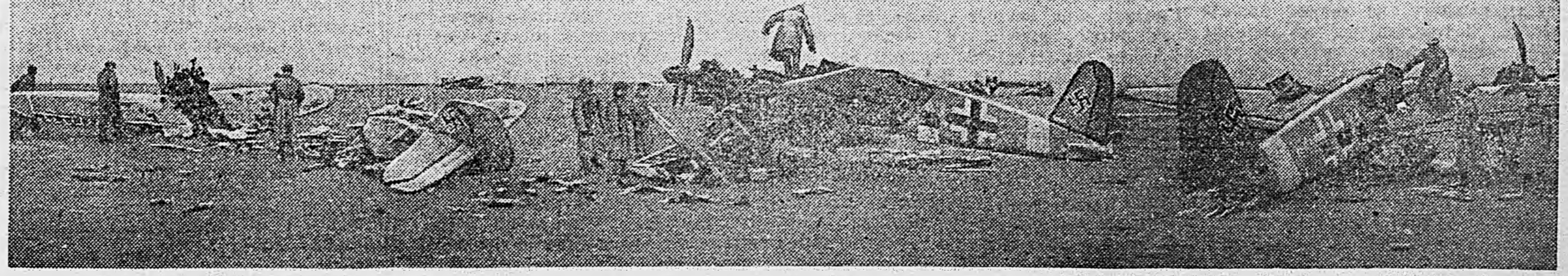
НА ПЕРЕКОПСКОМ ПЕРЕШЕКЕ. Немецкие самолеты, разбитые нашими войсками на одном из аэродромов.

Группа делегатов трудящихся Челябинской области, посетившая вновь открытые станции метро, в книге отзывов пишет: «При осмотре станций «Павелецкая» и «Новокузнецкая» охватывает восторг и гордость, что наши советские люди в период Отечественной войны создали такое величественное сооружение».