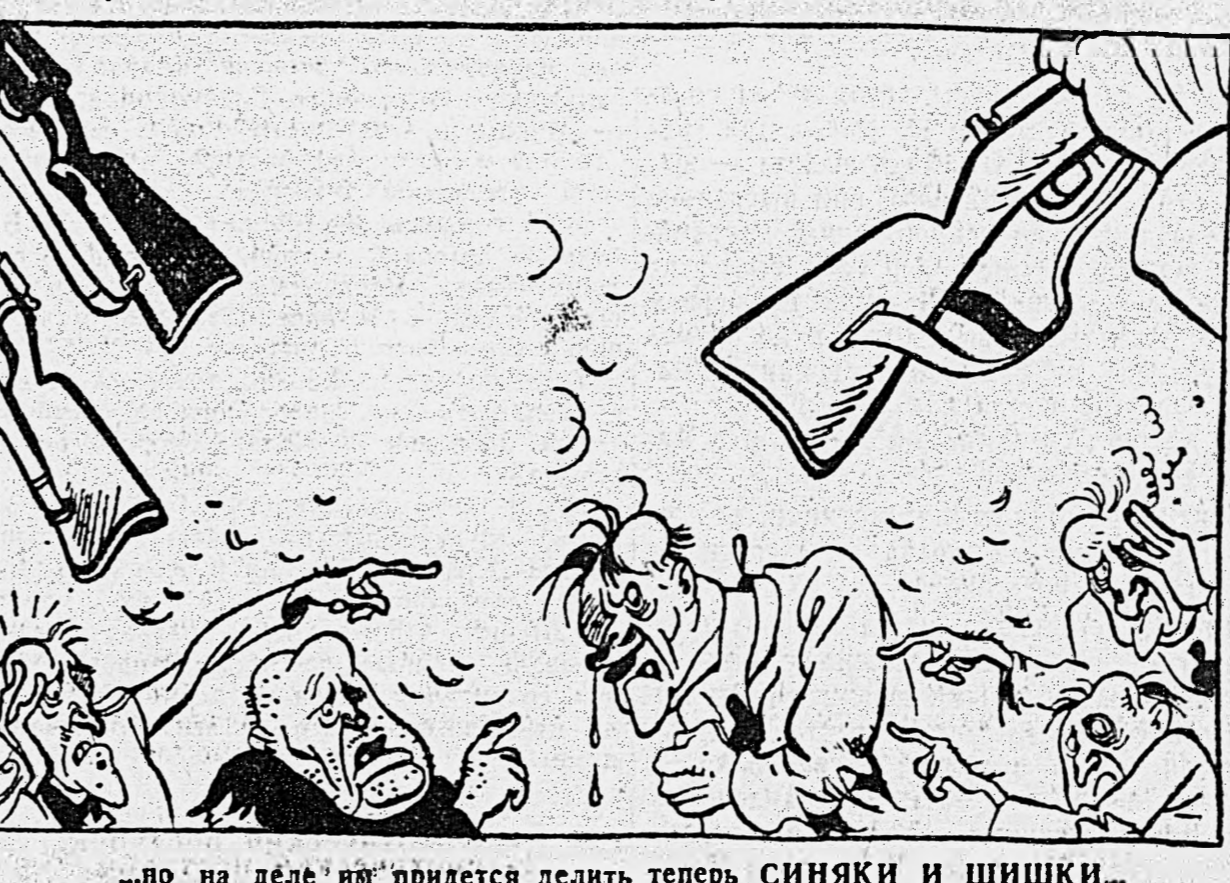
...по на деле им придется делить теперь синяки и шишки...