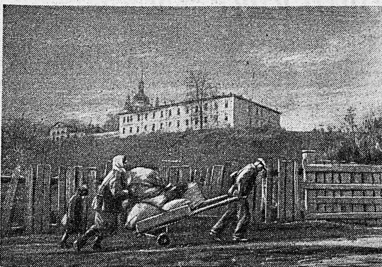
В ОСВОБОЖДЕННОМ КИЕВЕ. 1. Жители возвращаются в город. 2. Район Подола, снятый с самолета. Снимки наших спец. фотокорр. капитана А. Капустянского и старшего лейтенанта Г. Хомзоро.

Сообщения из Германии подтверждают, что недавно в Шаагене состоялась партийная конференция. Эти сообщения сходятся на том, что Гитлер не присутствовал на конференции. Указывается, что впервые его даже не предупредили заранее о созыве партийной конференции. Это вызвало большую сенсацию в Германии.