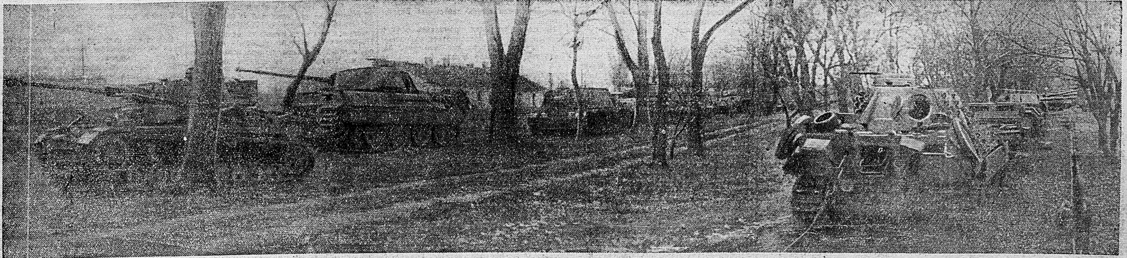
Криворожское направление. Немецкие танки, подбитые и захваченные нашими войсками.