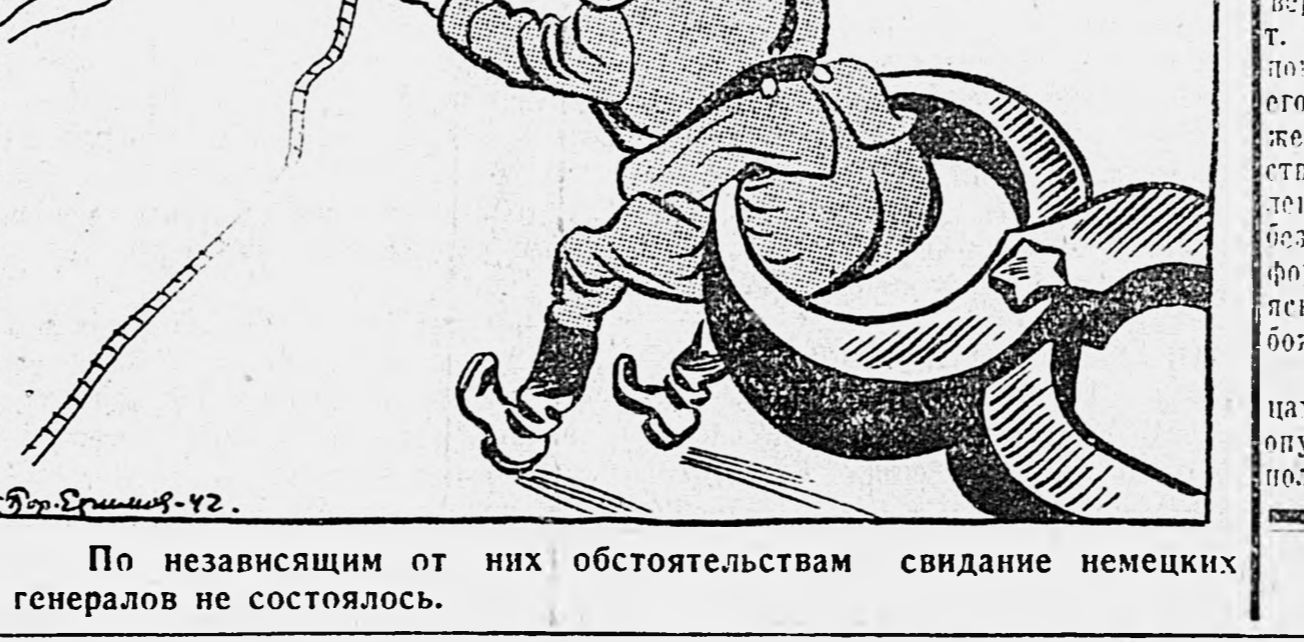
По независимым от них обстоятельствам свидание немецких генералов не состоялось.