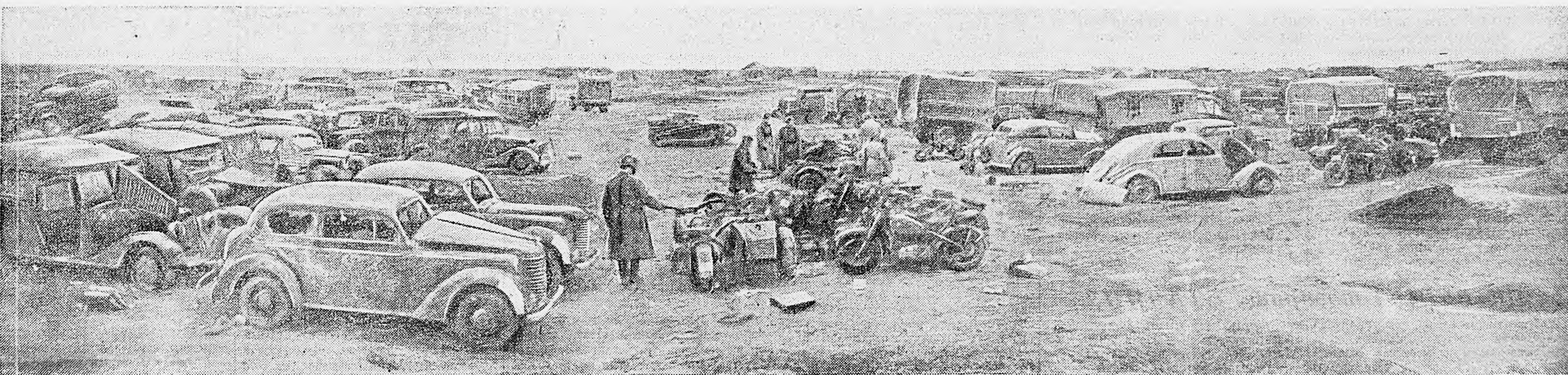
ЮГО-ЗАПАДНЕЕ СТАЛИНГРАДА. Немецкие автомашины и мотоциклы, захваченные нашими войсками.

СТАЛИНГРАДСКИЙ ФРОНТ, 18 декабря. (По телеграфу от наш. корр.). На одном из участков фронта гитлеровцы регулярно ведут пулеметный огонь по нашим траншеям. Разрешившись на вражеские позиции, находившиеся в дзотах, было довольно трудно, и лейтенант Шадрин решил применить