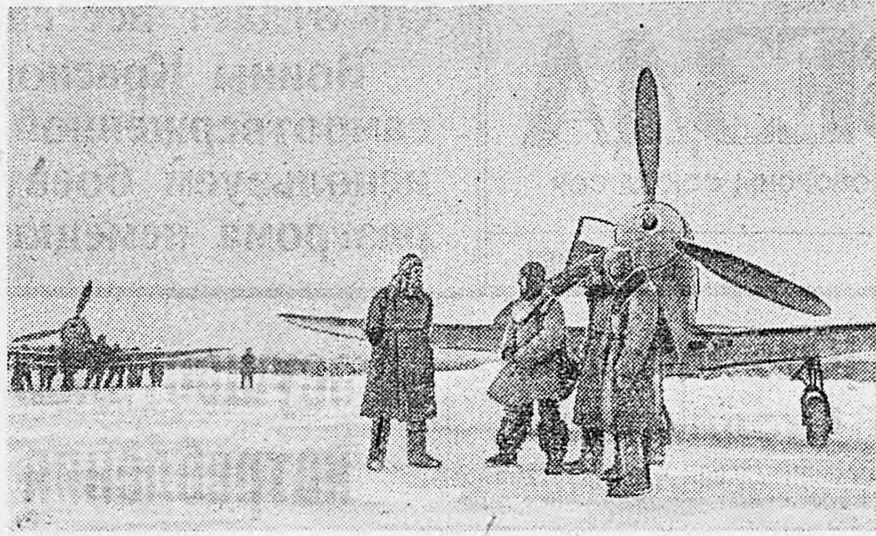
НА СЕВЕРЕ. Истребители И авиачаста перед вылетом на операцию. Снимок нашего спец. фотокорр. Я. Халина.