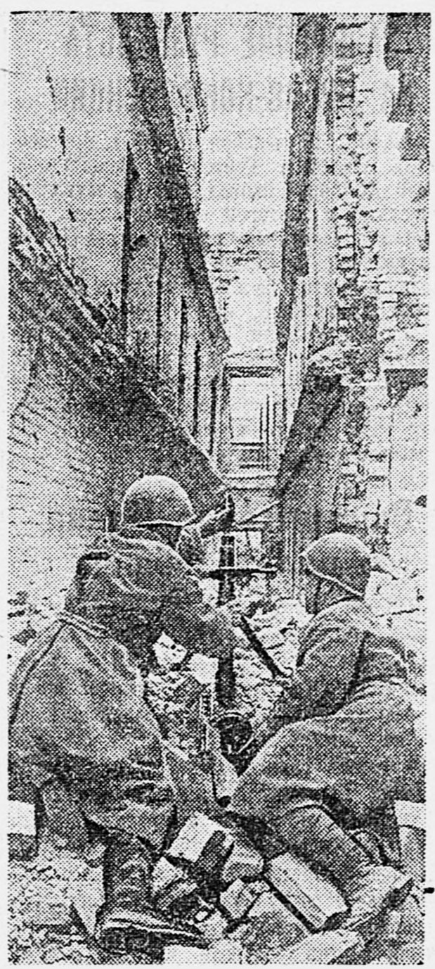
В СТАЛИНГРАДЕ. Минометчики ведут огонь по немцам.

Немецко-фашистская стратегия терпит крах за крахом. Обнадежит сталинская стратегия. Задача наших войск — это использовать свои успехи на юге для создания и удержания инициативы операции, полностью призрачной мудрой сталинской стратегии. Достигнутые тактические успехи надо уметь довести до конца, необходимо добиваться полного осуществления в каждой операции целей, поставленных высшим командованием.