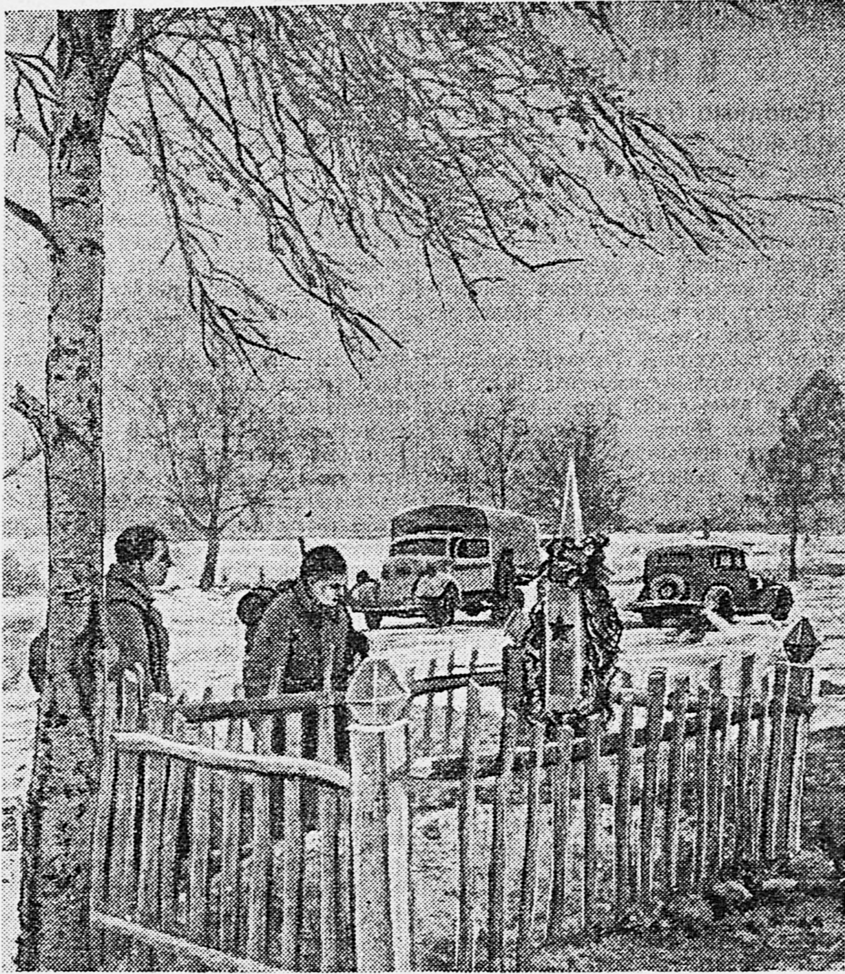
ЦЕНТРАЛЬНЫЙ ФРОНТ. У могил командира.