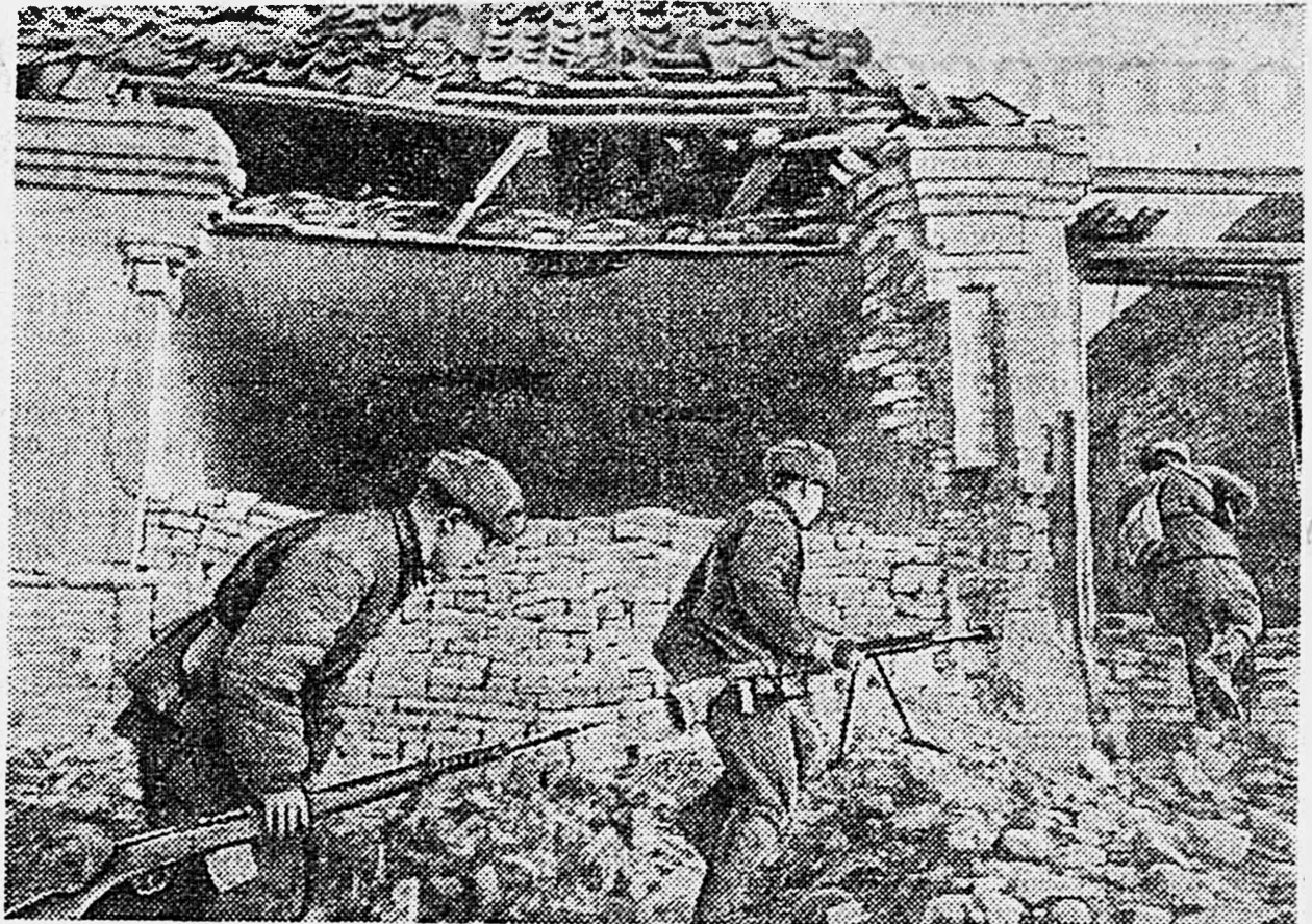
НА СЕВЕРНОМ КВКАЗЕ. Бой в населенном пункте. Бронбойщиками переходят на новую позицию.

Управление артиллерийской поддержки пехоты будет децентрализовано, так как основная оборонительная полоса строится по принципу обороны на широком фронте. Группы дальнего действия остаются в руках старшего артиллерийского начальника и занимают позиции на тех направлениях, где наиболее вероятны атаки противника. Большую часть этой артиллерии следует прибивать к флангам.