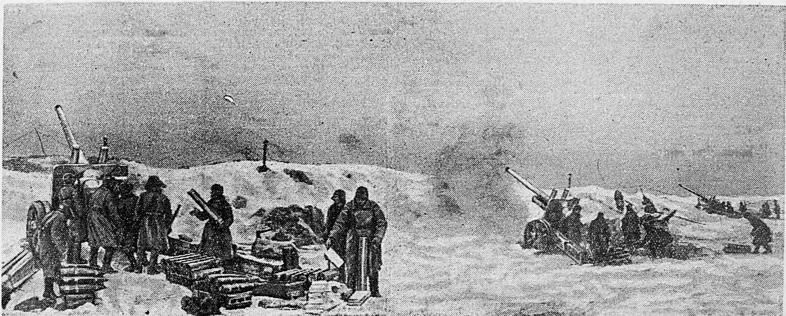
ЦЕНТРАЛЬНЫЙ ФРОНТ. Батарея тяжелой артиллерии на огневой позиции.