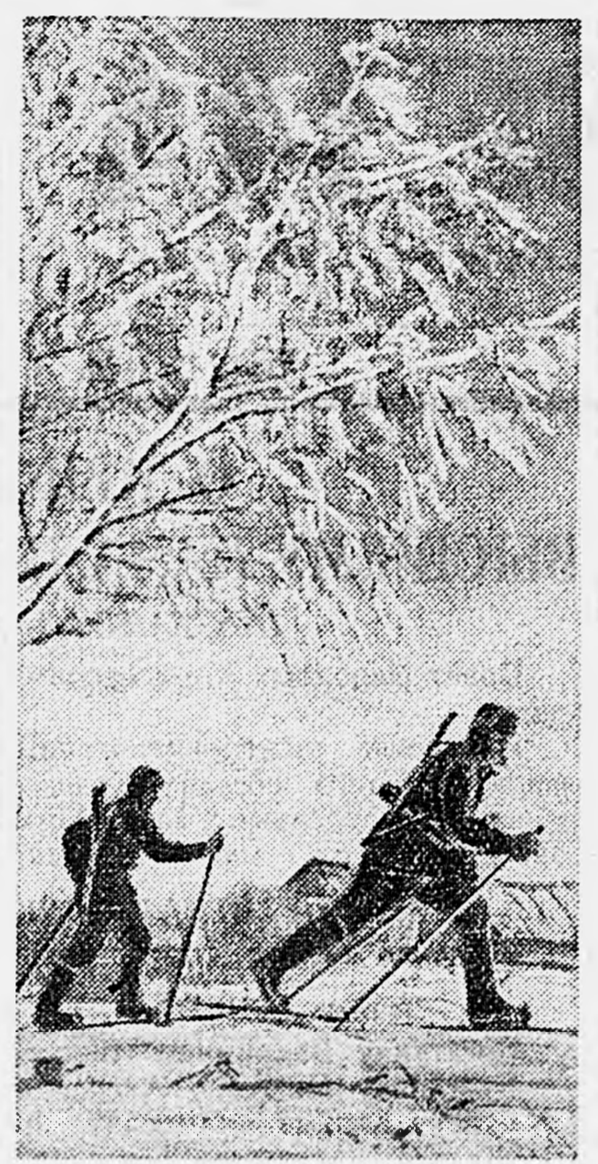
СЕВЕРО-ЗАПАДНЫЙ ФРОНТ. Связисты направляются на выполнение боевого задания.

На другом участке противник контратаковал наши подразделения двумя группами пехоты: одна насчитывала до 150 и другая до 300 солдат и офицеров. Пулеметным и минометным огнем эта контратака была отбита. Враг понес потери и рассеялся по степи.