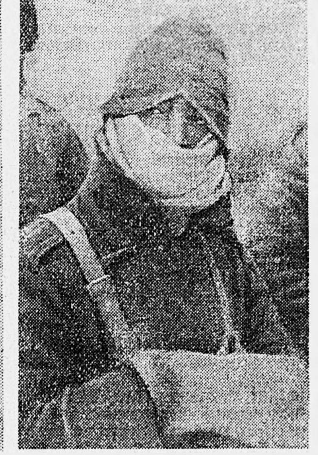
СЕВЕРО-ЗАПАДНОЕ СТАЛИНГРАДА. Зимние формы образца 1942 года.