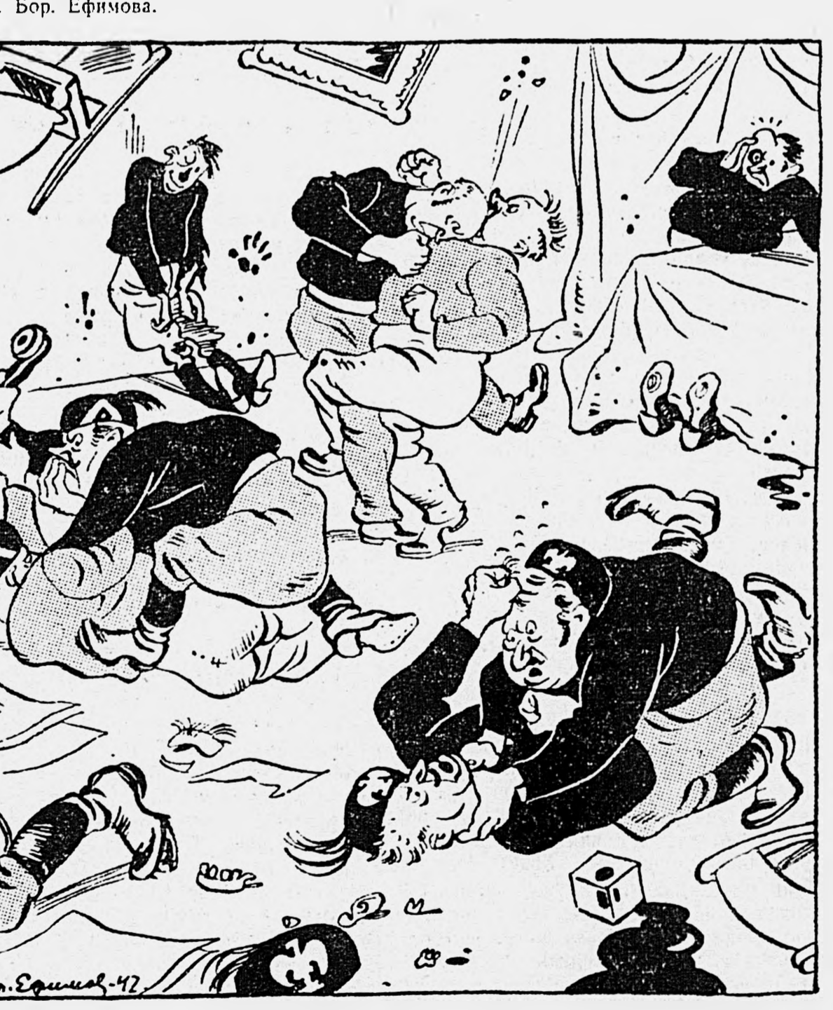
По докладу о международном и внутреннем положении Италии развернулись оживленные ТРЕНИЯ.

Внутри фашистской партии увеличиваются смятение и раздоры. Каждое собрание фашистских главарей сопровождается крупными драками.