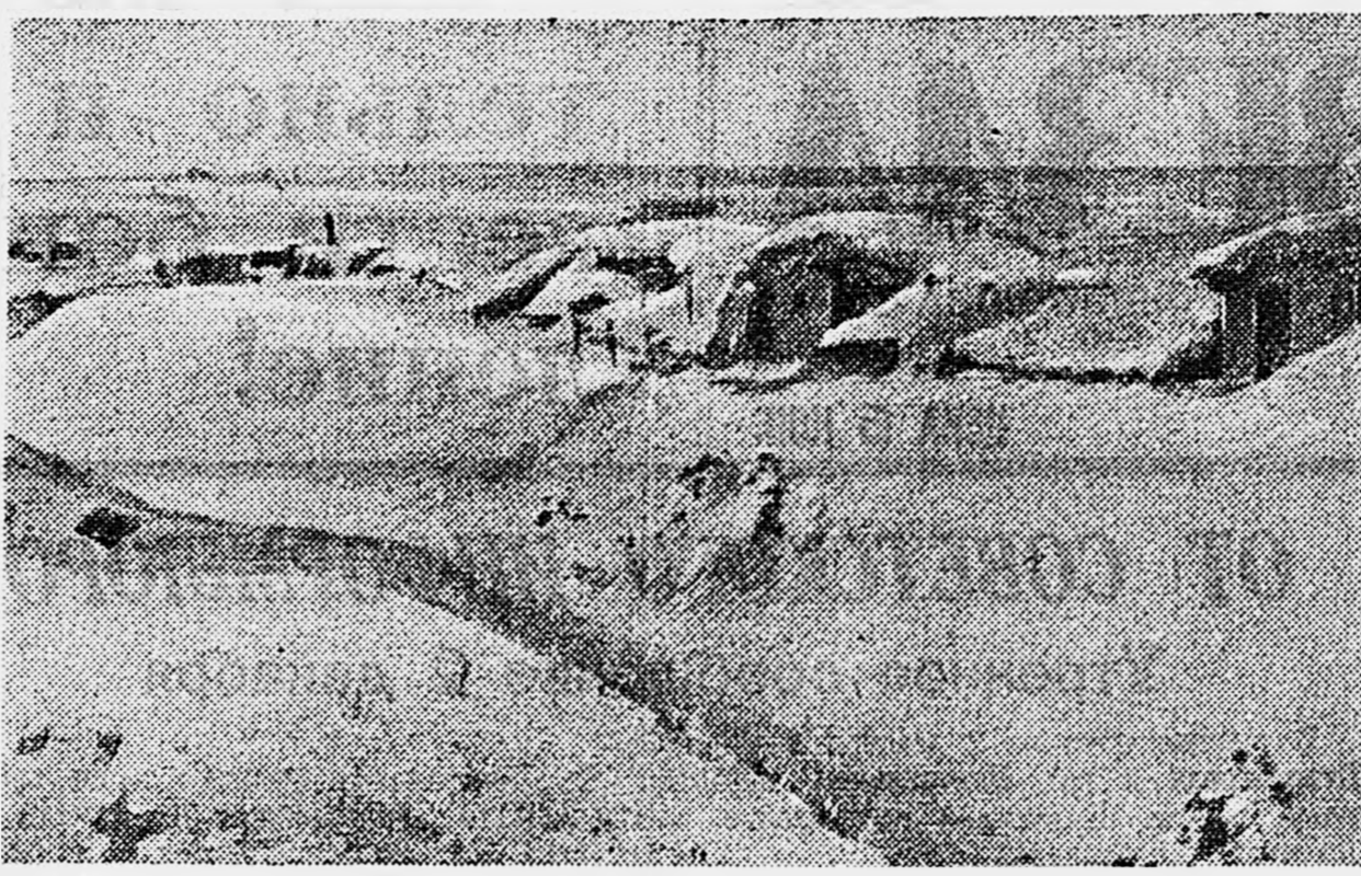
СЕВЕРО-ЗАПАДНОЕ СТАЛИНГРАДА. На снимках: 1. Немецкая линия обороны, прованная нашими войсками. 2. Склад военного имущества, брошенный отступающими немцами.