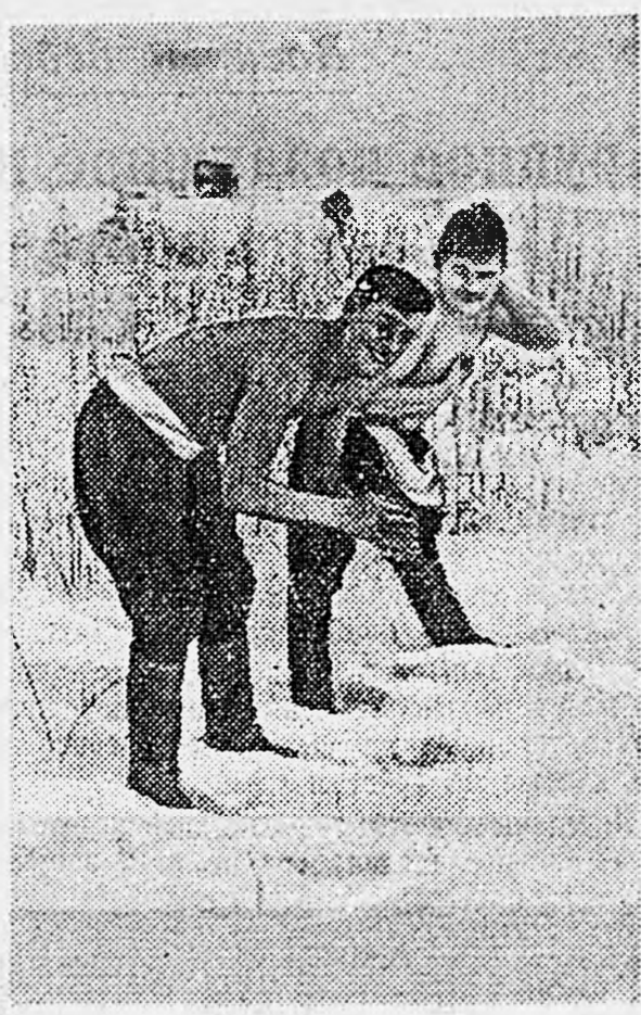
ДЕЙСТВУЮЩАЯ АРМИЯ. Утренний туалет.