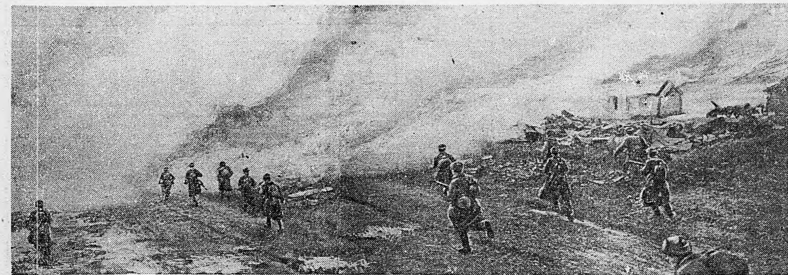
СЕВ.-ЗАПАДНОЕ СТАЛИНГРАДА. Бойцы части, которой командует полковник Шехтман, занимают населенный пункт.

Важная роль принадлежит артиллерии и в отражении неприятельских контратак. Эти контратаки на ряде участков в последние два дня учащаются. Немцы не останавливаются ни перед чем, пытаются вернуть утраченные позиции и задержать наше наступление. Южнее Ржева сегодня противник предпринял несколько контратак одну за другой. В этих контратаках вместе с пехотой участвовали танки. Каждый раз, как только неприятельские танки появлялись на поле боя, наша артиллерия, в особенности противотанковая, открывала такой огонь, что они вынуждены были повернуть и уходить обратно. Таким образом, ни одна немецкая контратака успеха не имела. На поле боя противник оставил несколько танков.