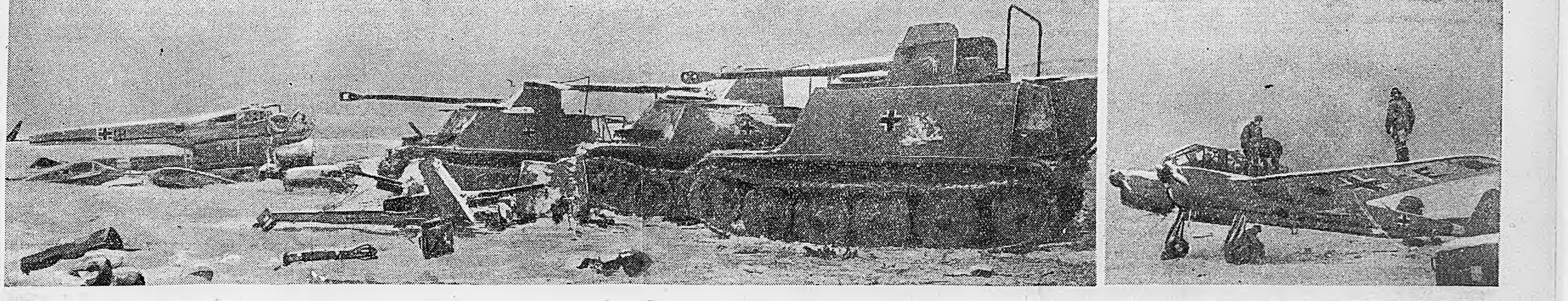
СЕВЕРО-ЗАПАДНЕЕ СТАЛИНГРАДА. Военная техника противника, разгромленная нашими войсками.