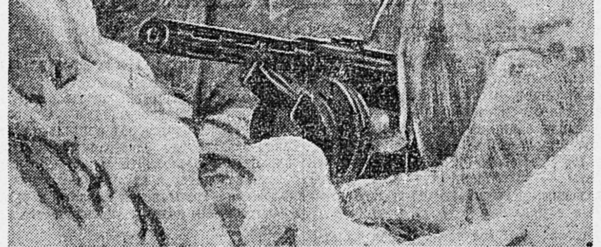
ДЕЙСТВУЮЩАЯ АРМИЯ. Разведчики.

Сообщение это было встречено с непередаваемым волнением. Раненые войны обратились к своим боевым товарищам с приветствием: — Дорогие товарищи! Мы сейчас находимся далеко от вас, но сердцем, мысленно — с вами. Говните, громите проклятия немцам, но полк сражения и будем бит гитлеровцев плечом к плечу с вами.