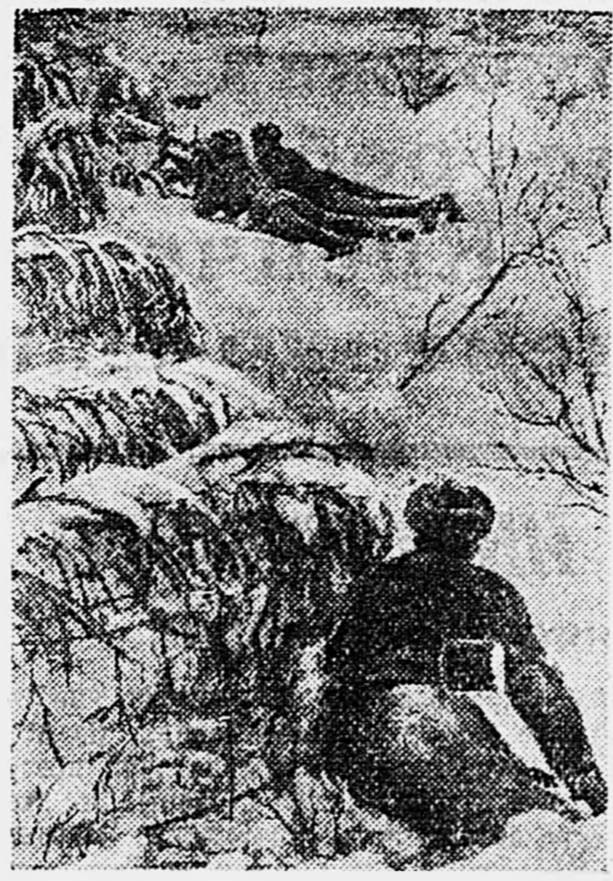
ДЕЙСТВУЮЩАЯ АРМИЯ. Временная огневая позиция пулеметного расчета.

И. БУКОВСКИЙ. СЕВЕРО-ЗАПАДНЕЕ СТАЛИНГРАДА.