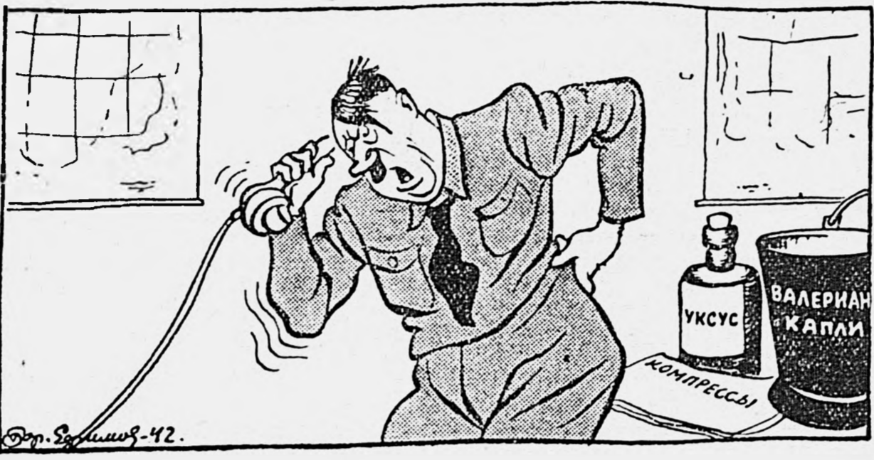
— Отвайсиж, дуче! У меня самого сталинградский прострел!