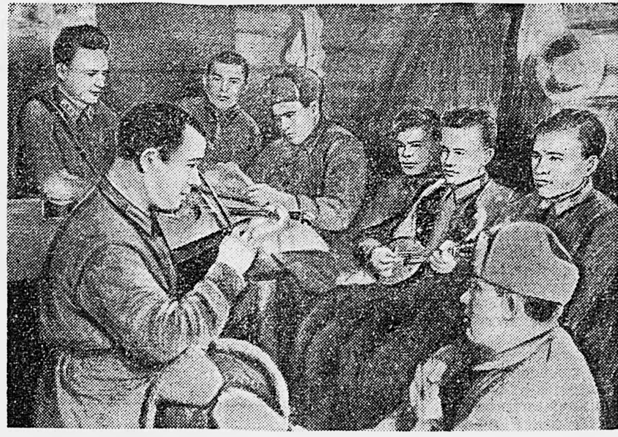
ЗАПАДНЫЙ ФРОНТ. В красноармейской землянке.