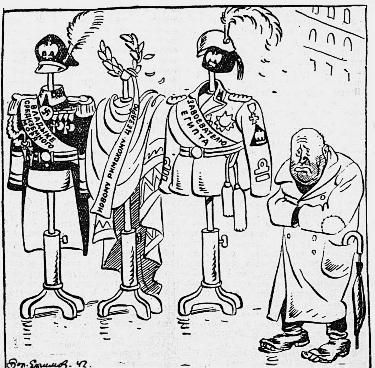
Дешевая распродажа ненужного гардероба.