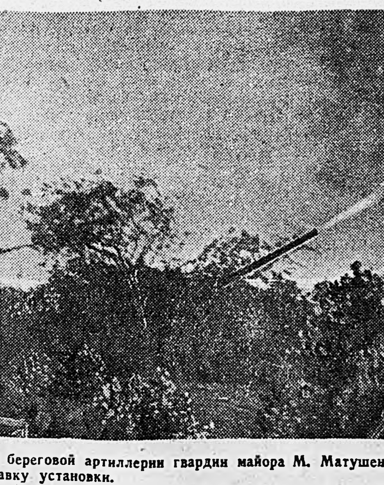
СЕВЕРНЫЙ КАВКАЗ. В подразделении береговой артиллерии гвардии майора М. Матушенко. На снимках: 1. Телефонист передает команду «открыть огонь». 2. Выстрел. 3. Правый командир вводит поправку установки.