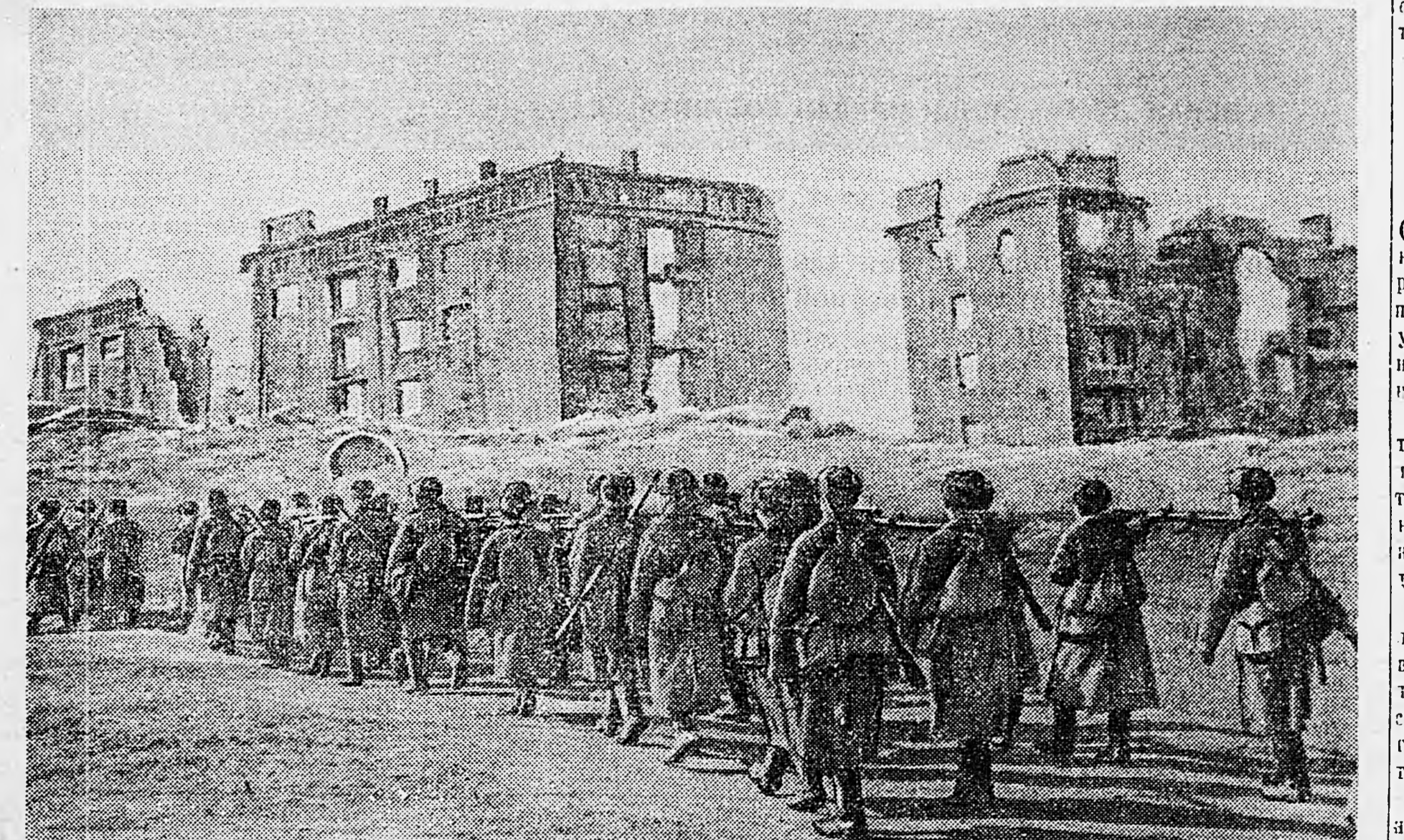
В СТАЛИНГРАДЕ. Идут подкрепления.