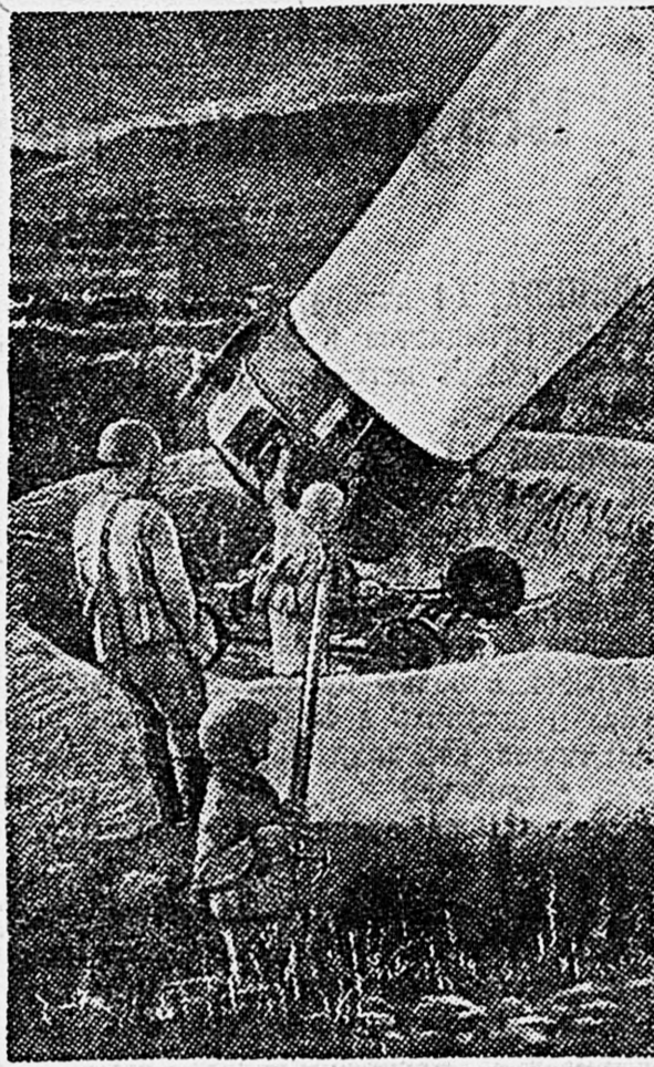
НА СЕВЕРНОМ КAVKAZE. Проектористы ведут поиск. Снимок нашего спец. фотокорр. Г. Хомзоро.

Во взводе образцово налажена рационализаторская и изобретательская работа. Сержант Крутоко сконструировал приспособление для отливки отстойника, в кузове Величко — для правки в холодном виде лонжеронов и передних осей автомашин. Сержант Страхос изобрел прибор для постановки передней рессоры. Успешно применяется приспособление собственной конструкции для выпрессовки втулок промежуточной шестерни и кулачкового вала.