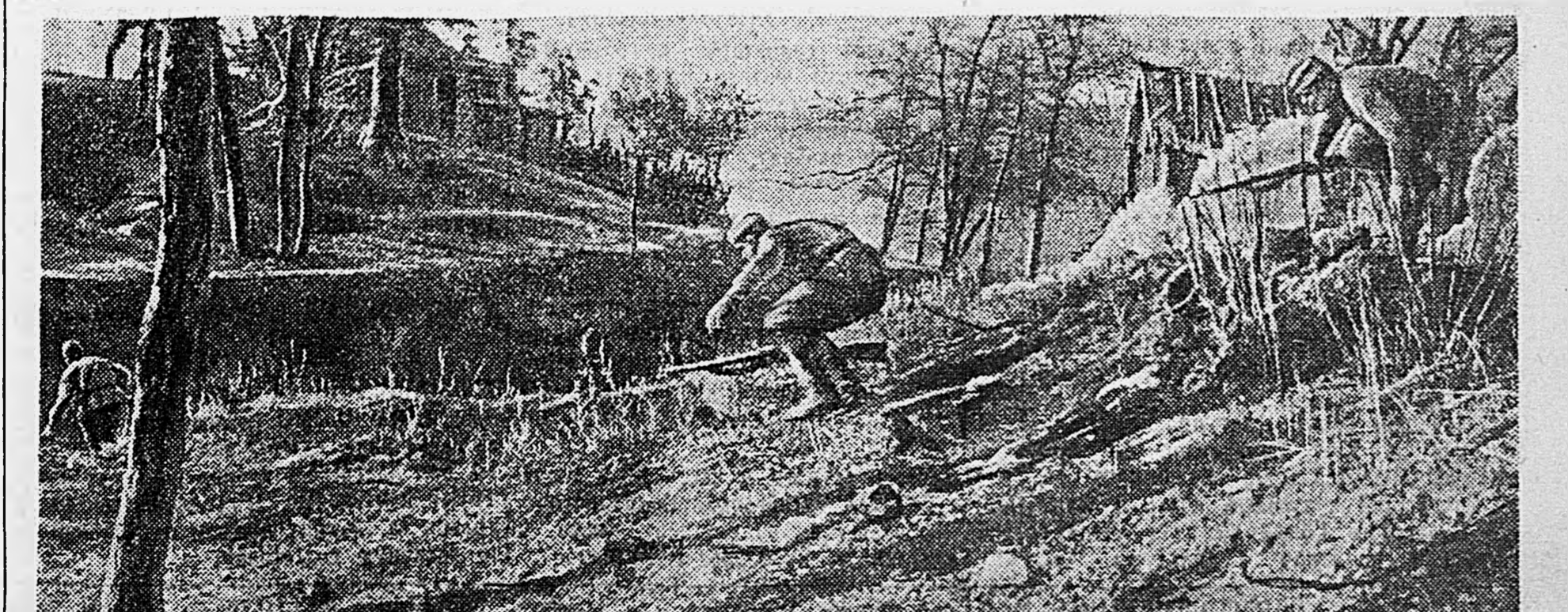
НА СЕВЕРНОМ КAVKAZE. Перебежка перед атакой.

История освободительной борьбы советских народов богата опытом партизанской войны. Большевики изучили этот опыт, обобщили его, превратили в устав партизанской борьбы. Этот опыт, обогащая его новыми приемами, используют герои, участники современной партизанской борьбы против фашистских злодеев. Самоотверженная, мужественная борьба советских партизан сливается военно со стойкой борьбой Красной Армии, чтобы совместно усилиями разгромить фашизм — лютого врага нашей родины.