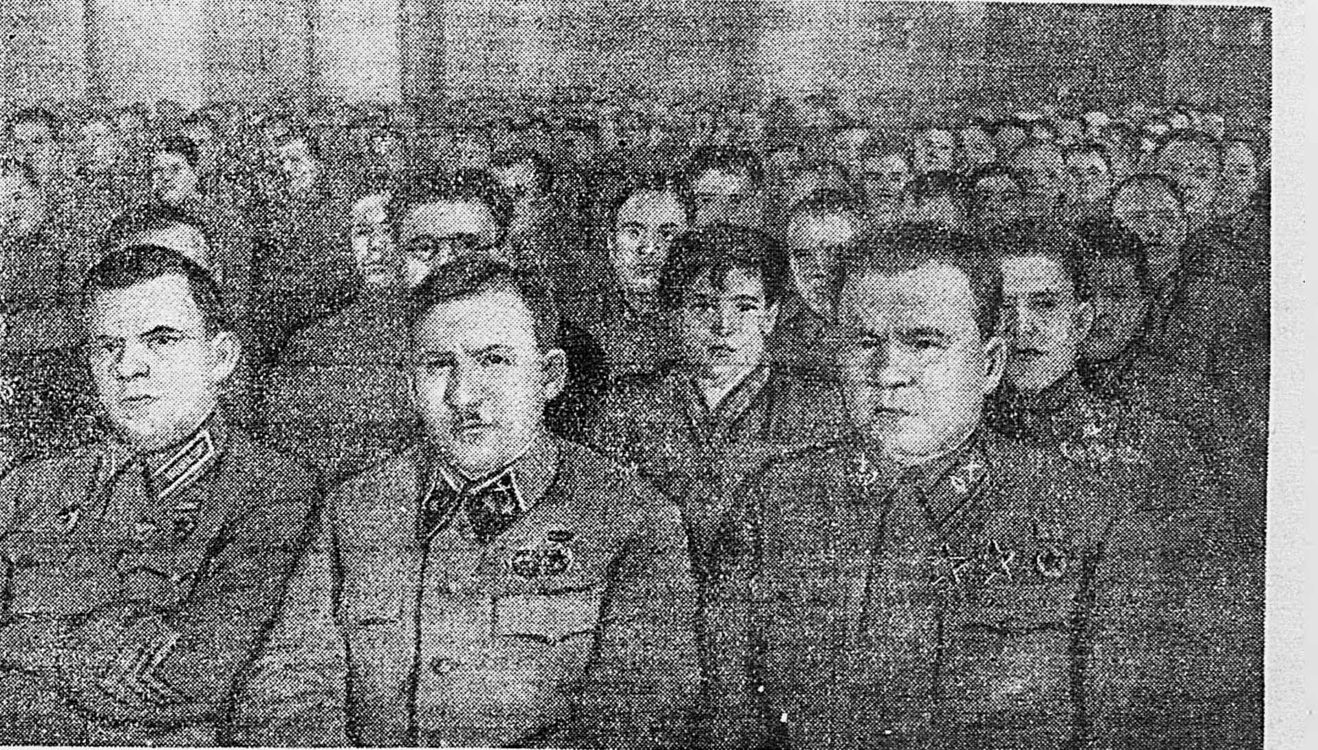
В городе Ленина. Торжественное заседание Ленинградского Совета, посвященное 25-летию Великой Октябрьской Социалистической революции. На снимках: 1. В президиуме, 2. Зал заседаний.