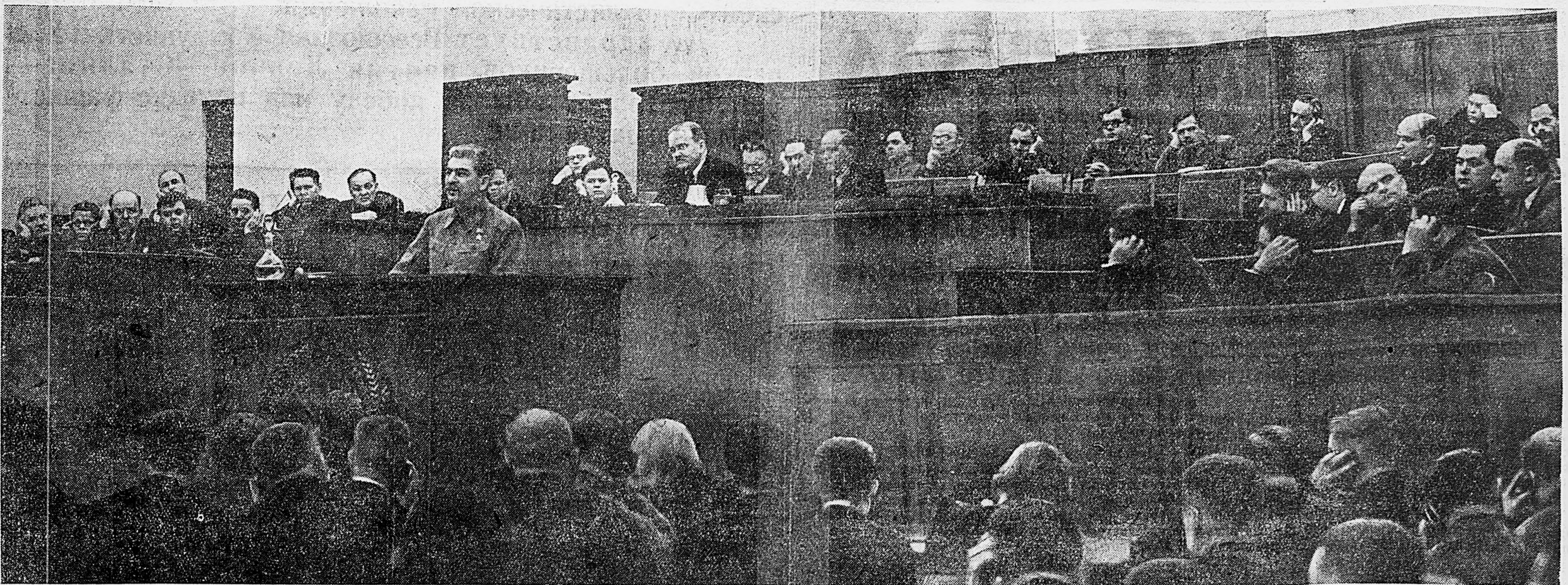
Торжественное заседание Московского Совета депутатов трудящихся с партийными и общественными организациями г. Москвы 6 ноября 1942 года. Товарищ И. В. Сталин делает доклад.