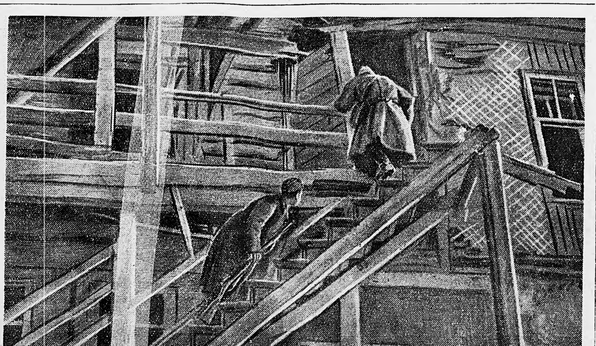
В РАЙОНЕ НОВОРОССИЙСКИХ ЦЕМЕНТНЫХ ЗАВОДОВ. Бойцы занимают дом, очищенный от немцев.

Великая Отечественная война советского народа не остановила дальнейшего развития советской печати. Только за год войны было издано до 350 миллионов экземпляров книг. 39-миллионным тиражом изданы речи, доклады и приказы Наркома обороны И. В. Сталина. (ТАСС).