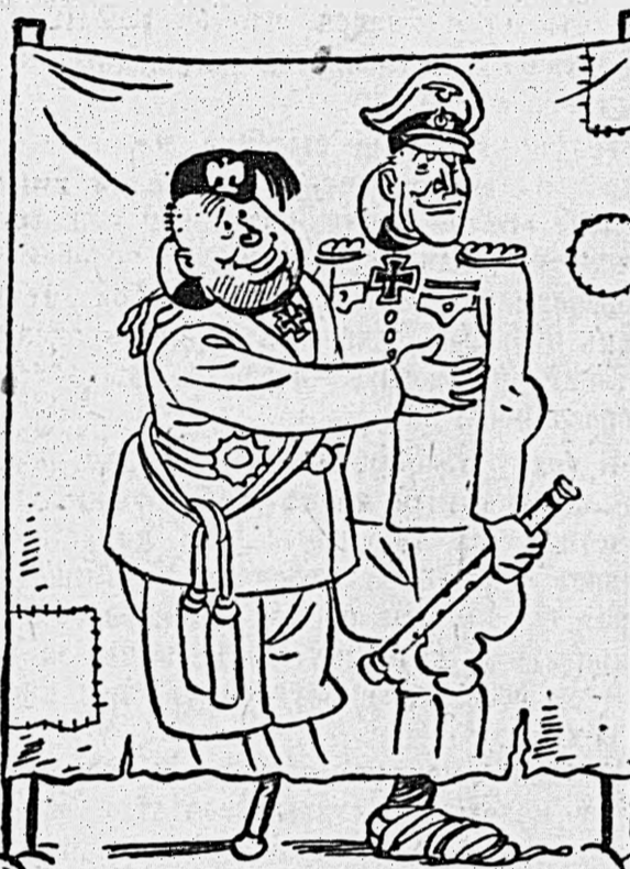
Сенас закончен. Важное свидание состоялось и запечатлено для прессы и кино.

«Вдруг оди итальянский офицер подошел к Муссолини и сказал ему, что в вестнике собраны германские военные корреспонденты, которые хотят написать об этой встрече и представить снимки для печати и кино. Муссолини, улыбаясь, становится рядом с Роммелем. Фотокорреспондент просит Муссолини и Роммеля теснее прижаться друг к другу, чтобы получился хороший снимок».