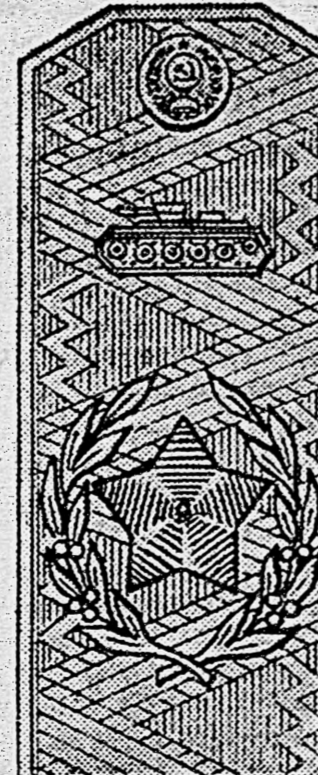
Главный маршал бронетанковых войск