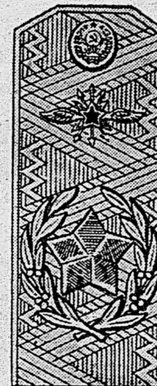
Главный маршал войск связи