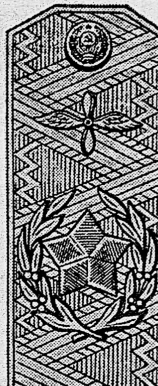
Главный маршал авиации