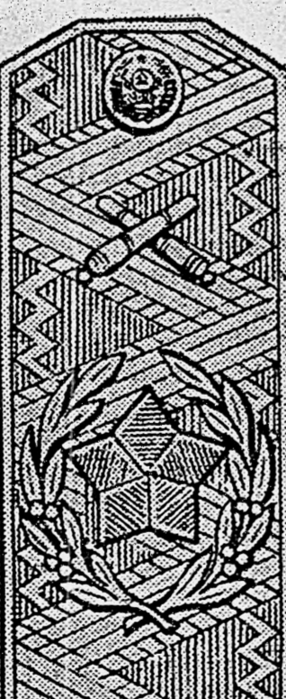
Главный маршал артиллерии