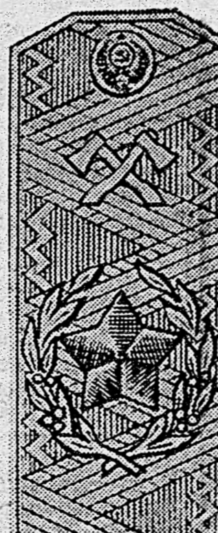
Главный маршал инженерных войск