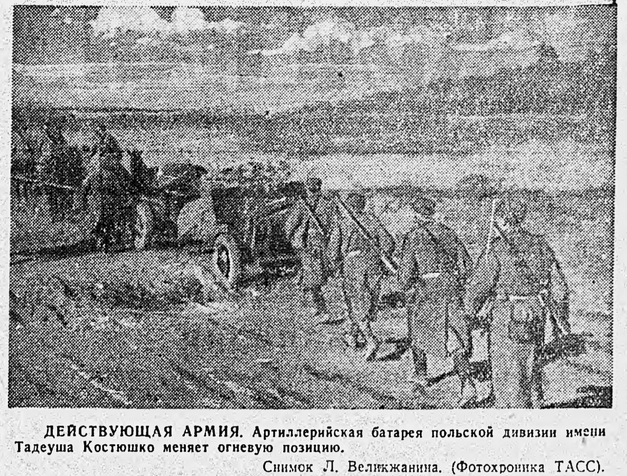
ДЕЙСТВУЮЩАЯ АРМИЯ. Артиллерийская батарея польской дивизии имени Тадеуша Костюшко меняет огневую позицию.