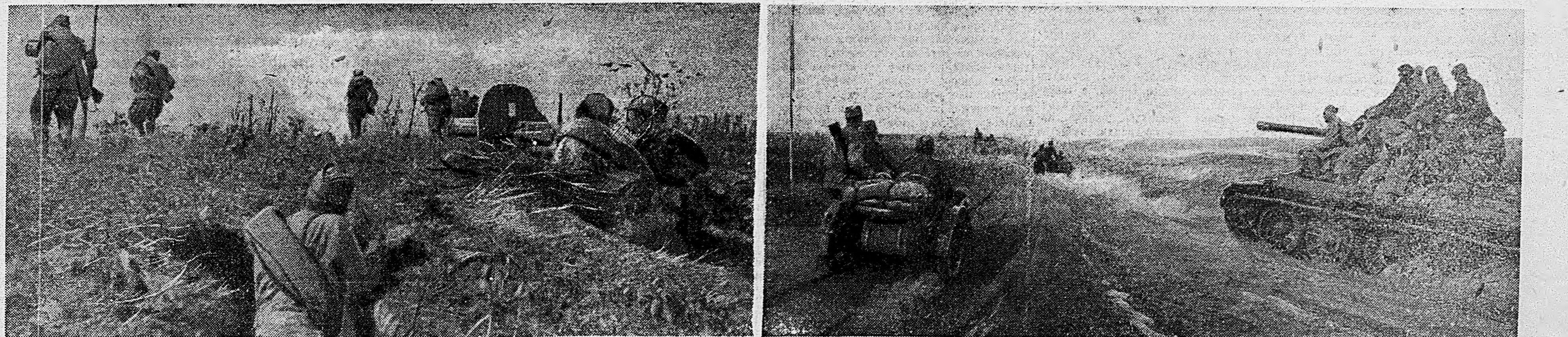
В РАЙОНЕ ЗАПОРОЖЬЯ. 1. Бойцы 82 Гвардейской Запорожской стрелковой дивизии атакуют противника. 2. Мотоциклетная часть на марше. Снимки нашего спец. фотокорр. майора С. Лоскутова и лейтенанта Ю Чернышева.

Тов. Н. Я. Наталевич после вручения орденов и медалей сердечно поздравил получивших награды товарищей и пожелал им наилучших успехов в их борьбе на полях сражений и на трудовом фронте. (ТАСС).