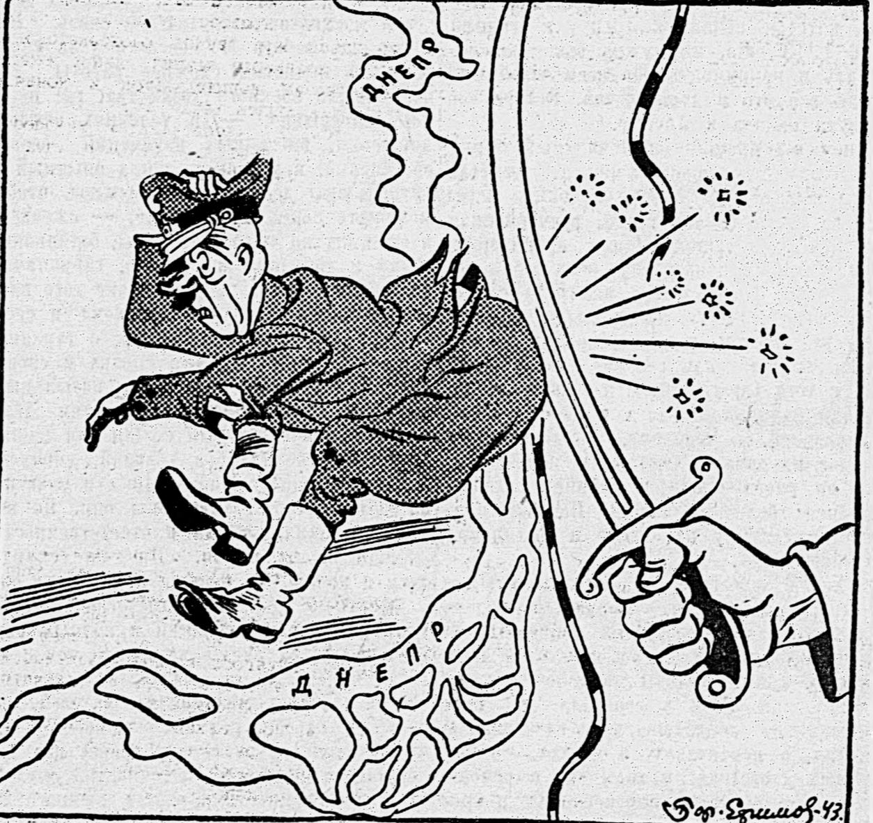
«Так вот она, СЕЧЬ!» (Н. В. Гоголь «Тарас Бульба»).