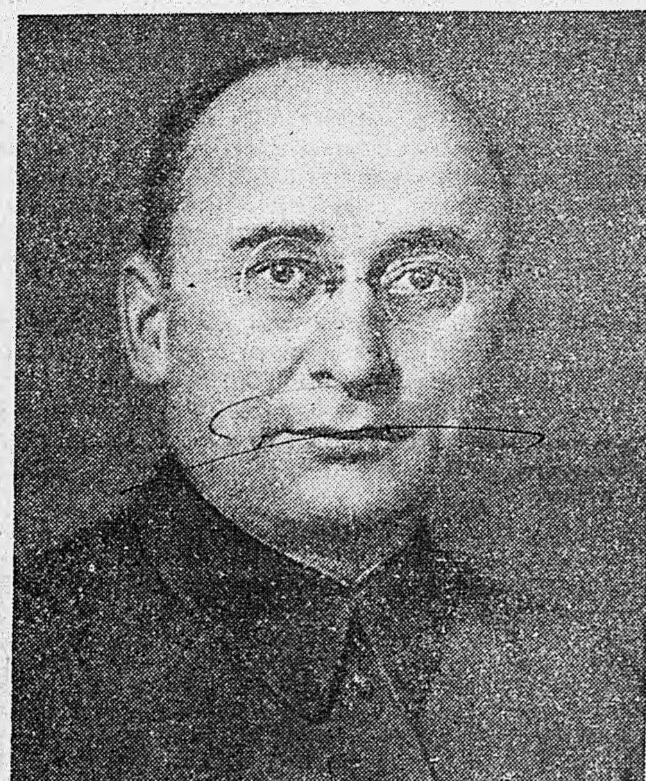
Герой Социалистического Труда тов. Л. П. БЕРИЯ.