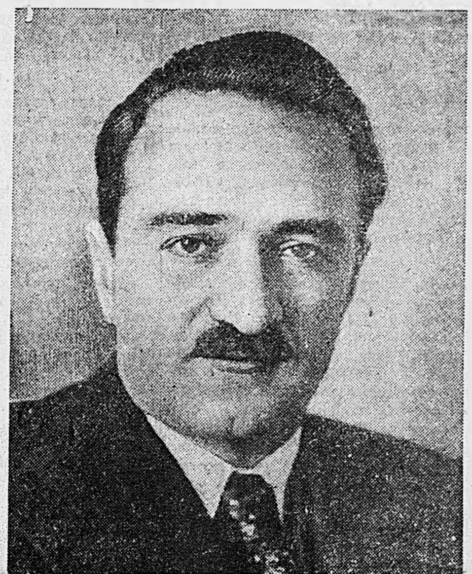
Герой Социалистического Труда тов. А. И. МИКОЯН.

У К А З ПРЕЗИДИУМА ВЕРХОВНОГО СОВЕТА СССР О присвоении звания Героя Социалистического Труда тов. МОЛотову В. М.