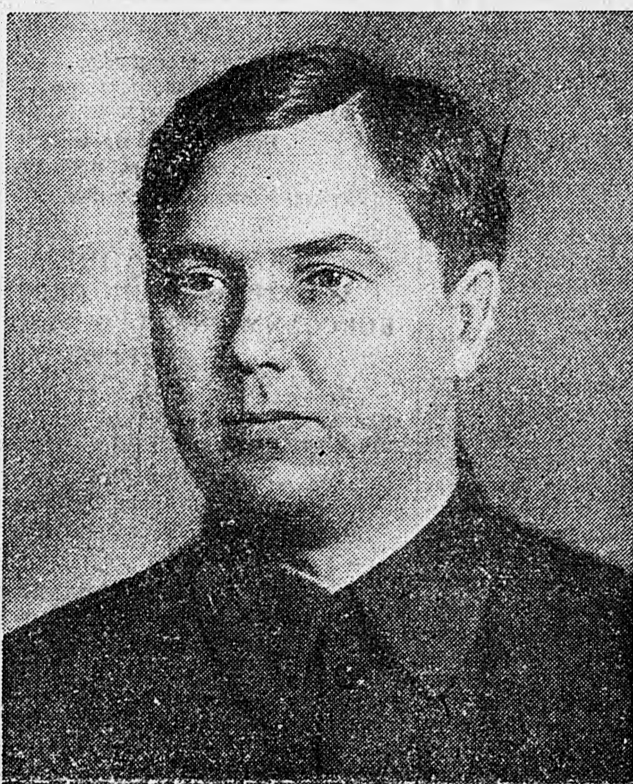
Герой Социалистического Труда тов. Г. М. МАЛЕНКОВ.