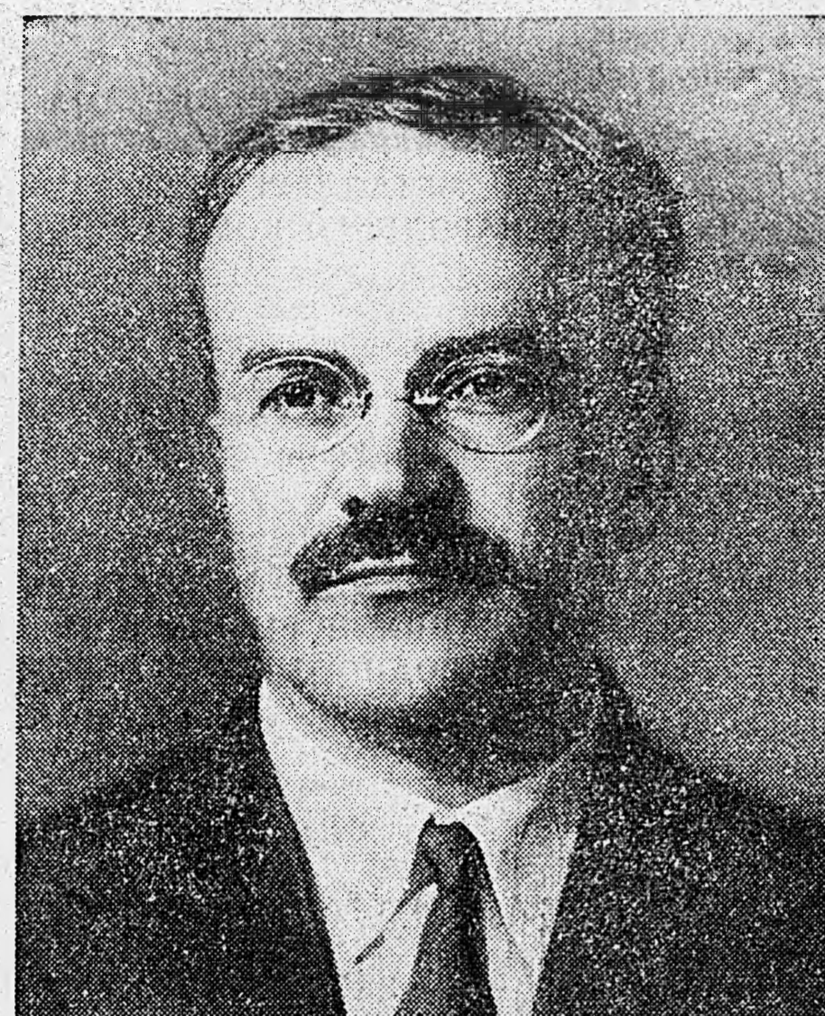
Герой Социалистического Труда тов. В. М. МОЛотов.

Слава Героям Социалистического Труда — выдающимся деятелям нашего государства, руководителям важнейших отраслей оборонной промышленности!