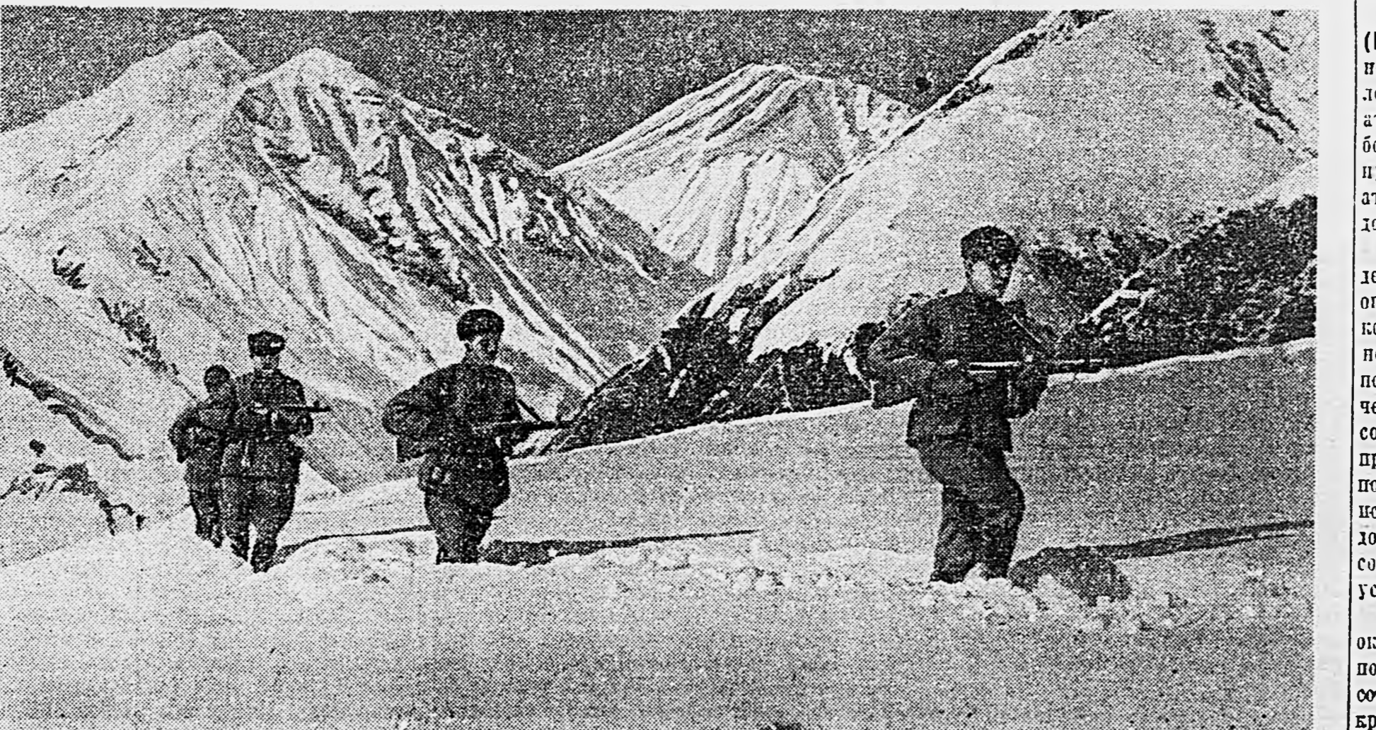
НА СЕВЕРНОМ КАВКАЗЕ. Первый снег.

Сегодня с утра враг снова пытался атаковать наши подразделения. Ожесточенный бой продолжится.