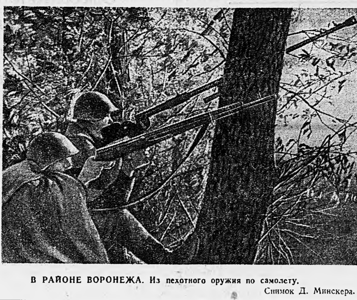
В РАЙОНЕ ВОРОНЕЖА. Из пехотного оружия по самолету.