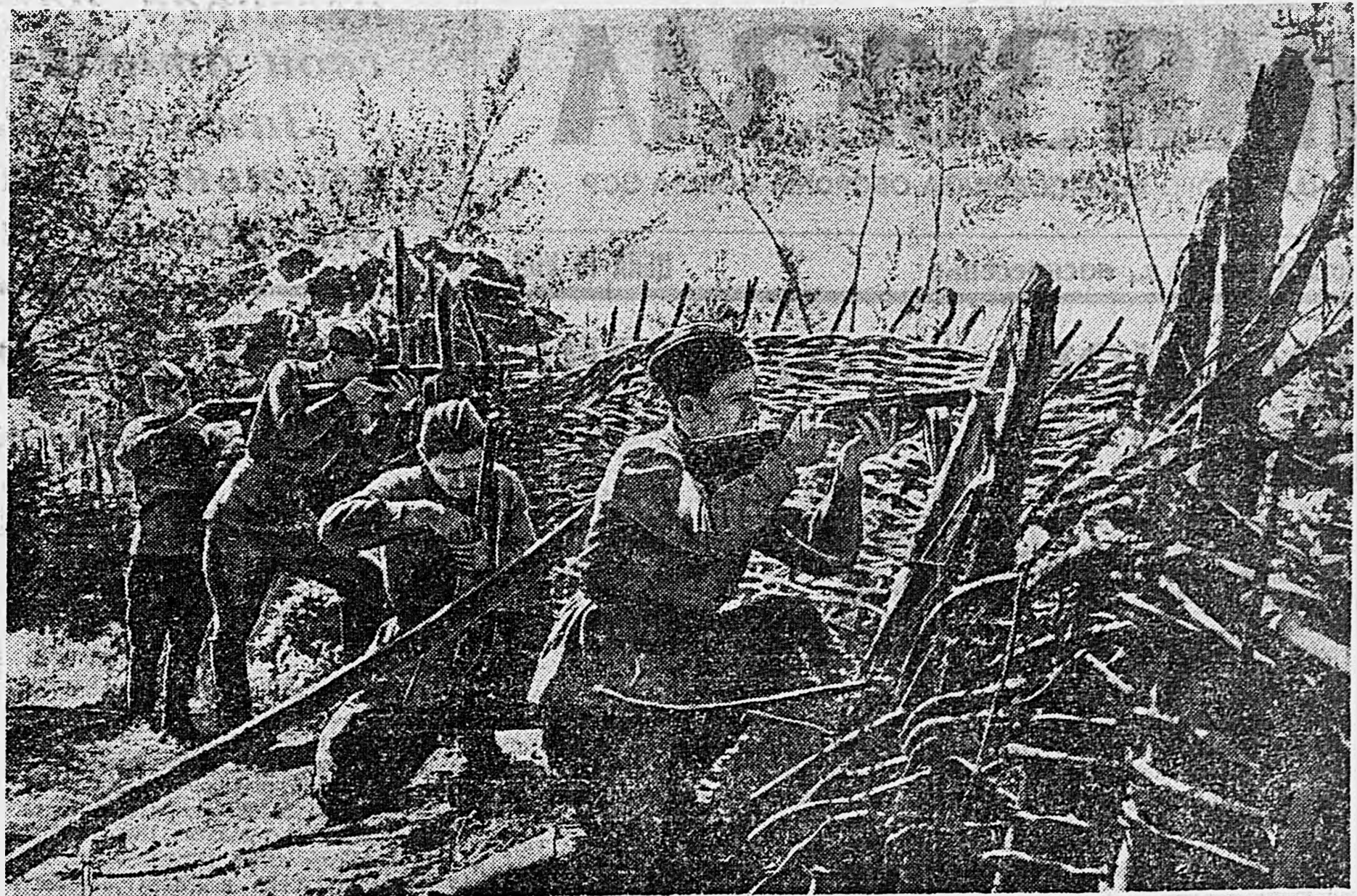
НА СЕВЕРНОМ КАВКАЗЕ. Автоматчики ведут огонь из засады.

Военный инженер 3-го ранга С. БОГАЕВСКИЙ.