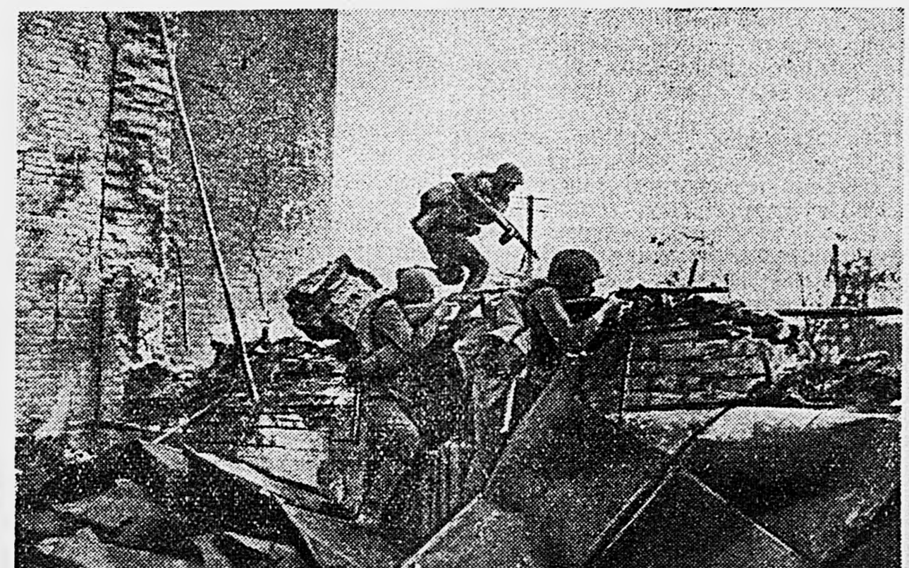
В СТАЛИНГРАДЕ. 1. Уличный бой на одной из окраин города. 2. Краснофлотцы идут в атаку.

В дополнение к этим Указам Президиум Верховного Совета СССР предоставил командирам полков право награждать нагрудными знаками рядового и младшего начальствующего состава.