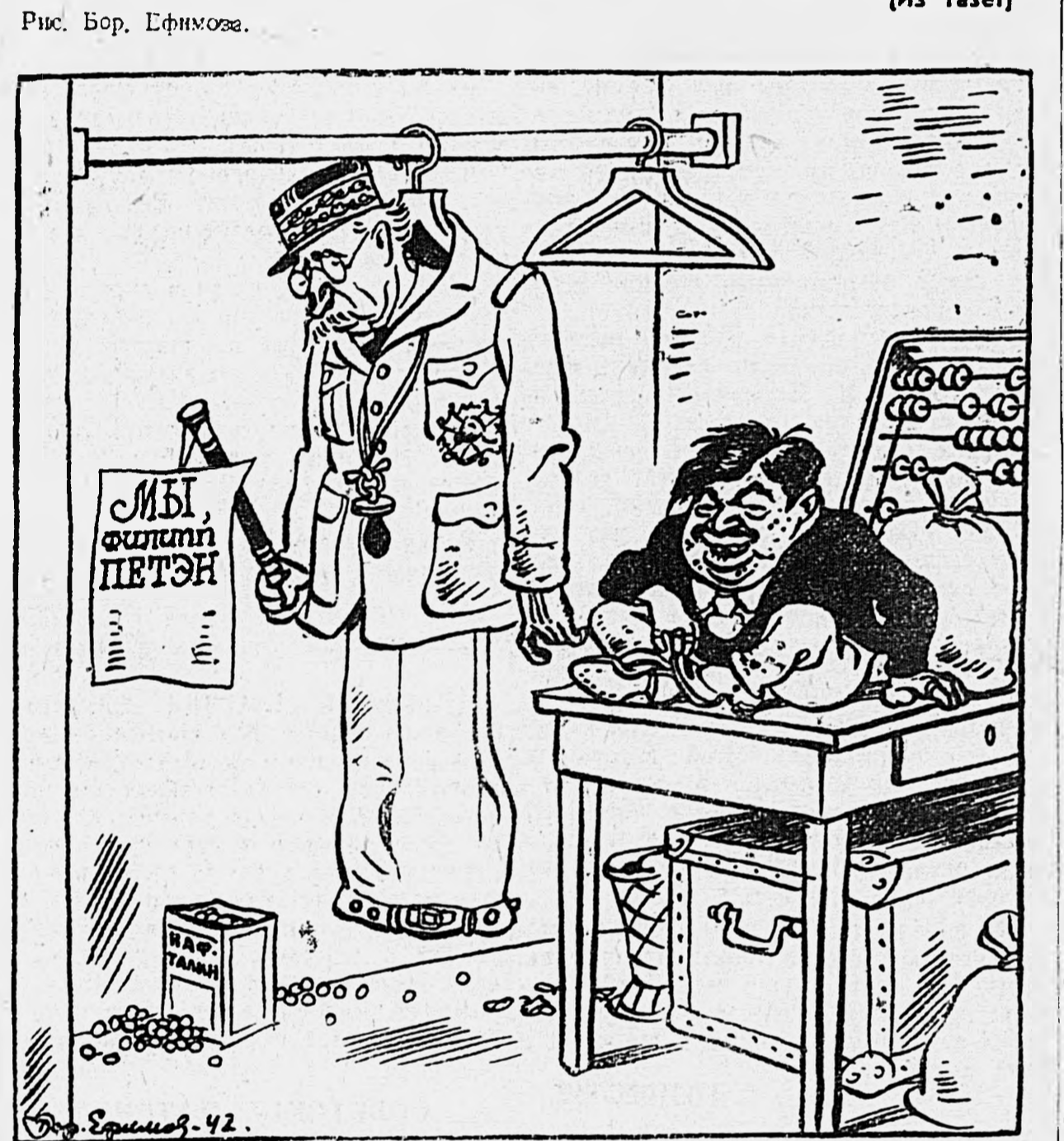
Хороший маклер для скверных сделок.

ЛОНДОН, 24 октября. (ТАСС). Как передает агентство Рейтер, 22 октября самолеты английской истребительной авиации атаковали коммуникации противника на оккупированной территории. Самолеты «Спитфайр» с бронею полета атаковали воздушный лагерь и несколько барж противника. Английские истребители не встретили никакого боя, но было собрано большое количество информации о противнике.