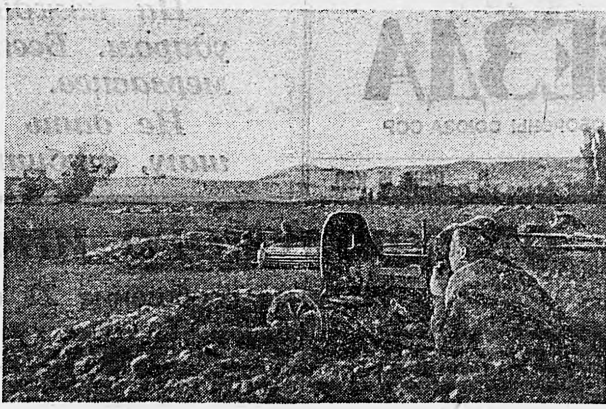
НА СЕВЕРНОМ КАВКАЗЕ. Станковый пулемет прикрывает пехоту, накапливающуюся для атаки.