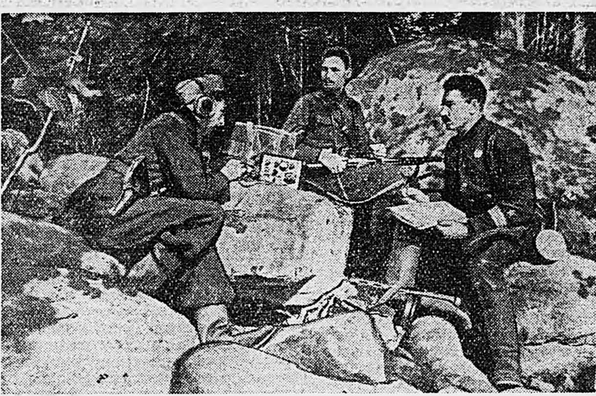
В ГОРАХ КАВКАЗА. Краснофлотец принимает радиogramму от своих разведчиков из немецкого тыла.

Молодые кандидаты партии с честью оправдывают высокое звание большевика и выносят боевые подвиги в боях на улицах Сталинграда.