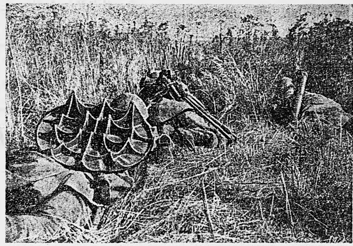
НА ДОНУ. РАЙОН ВОРОНЕЖА. Минометный расчет меняет позицию.