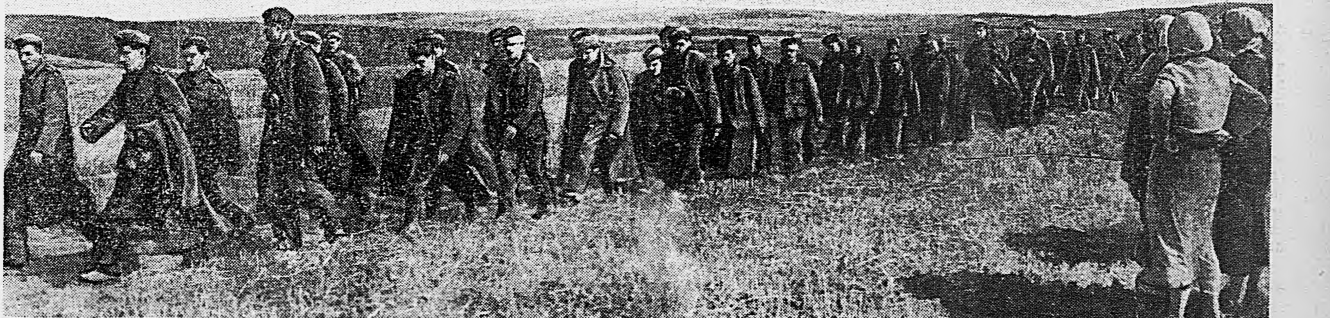
В РАЙОНЕ ВОРОНЕЖА. Группа немецких солдат, взятых в плен нашими частями.

На всех участках идет методическое истребление живой силы и техники оккупантов. За прошедший день снайперы уничтожили 197 вражеских солдат и офицеров. Артиллеристы и минометчики в свою очередь истребили за эти дни 449 гитлеровцев, уничтожили 10 ДОТов, 7 блиндажей, 2 минометных батареи, 3 станковых пулемета, 7 орудий, 46 повозок с грузами, 4 автомашин, склад с боеприпасами.