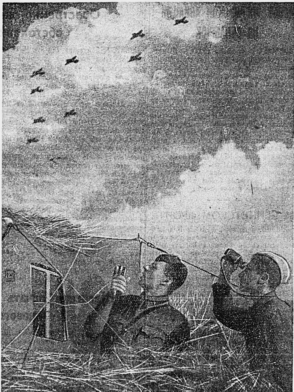
В СТАЛИНГРАДЕ. Управление самолетами по радио.