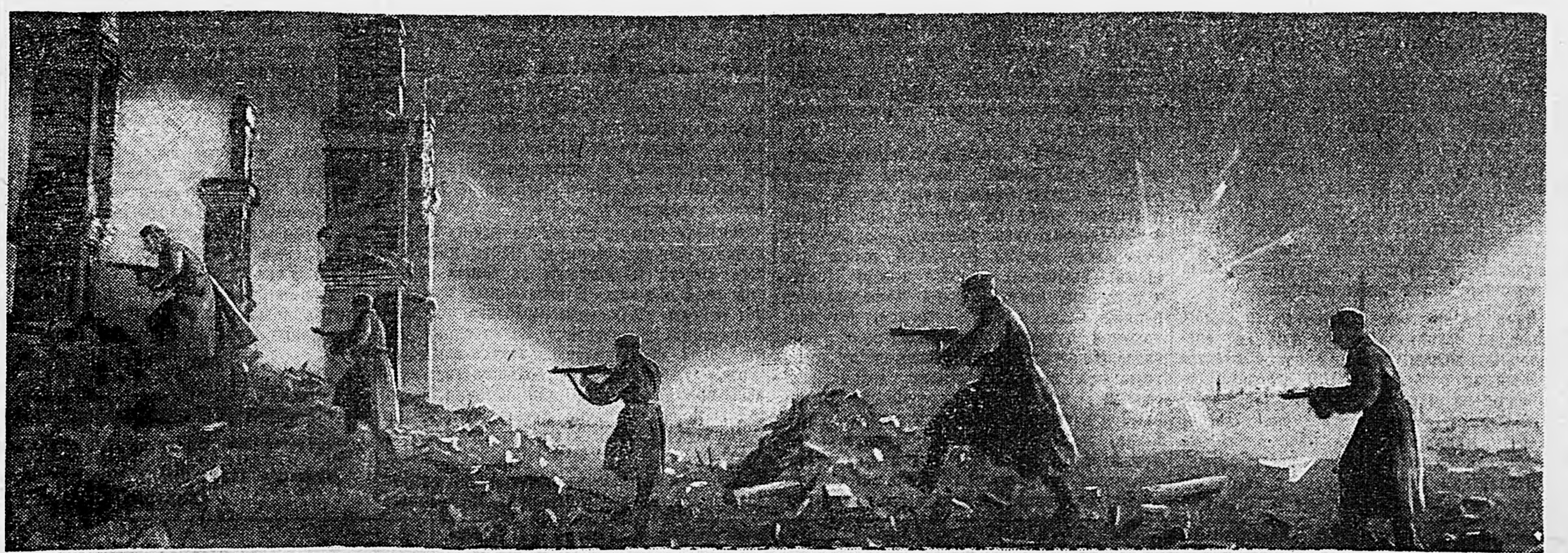
В СТАЛИНГРАДЕ. Ночной уличный бой.