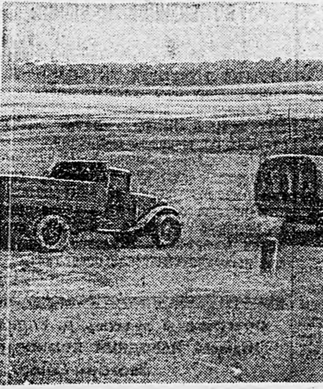
В СТАЛИНГРАДЕ. Подвоз боеприпасов.