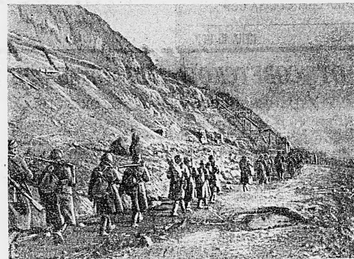
В СТАЛИНГРАДЕ. Прибывшие в город пополнения направляются на позиции.