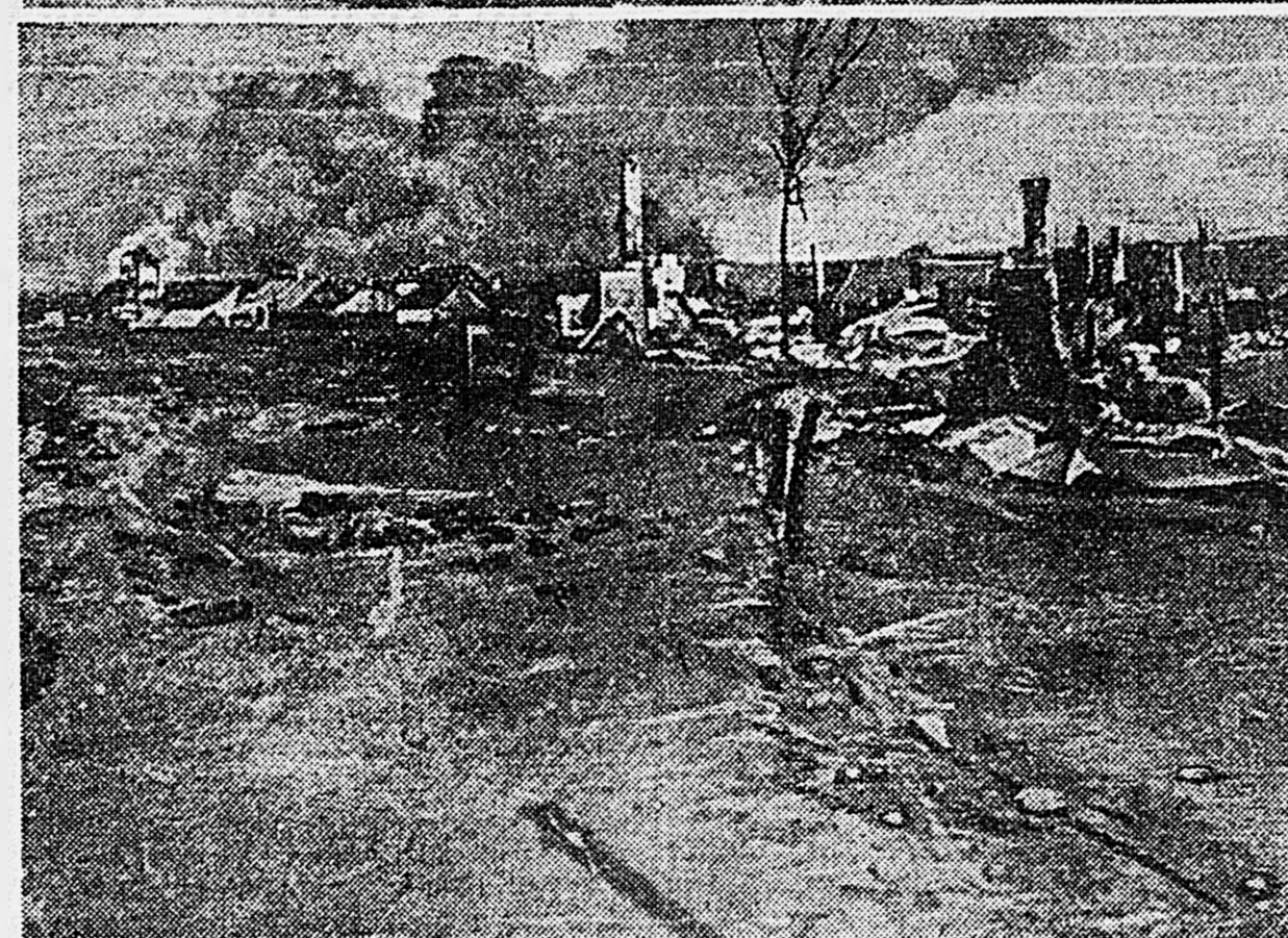
ЗВЕРСТВА НЕМЕЦКИХ ЗАХВАТЧИКОВ В ОККУПИРОВАННЫХ СОВЕТСКИХ РАЙОНАХ. Два снимка, найденные у убитого немецкого офицера, рисуют страшную картину расправы в одном селе. Груда мертвых тел — это население села, выгнанное из домов и расстрелянное фашистскими извергами. После кровавого побоища немцы подожгли опустевшее, разоренное село.