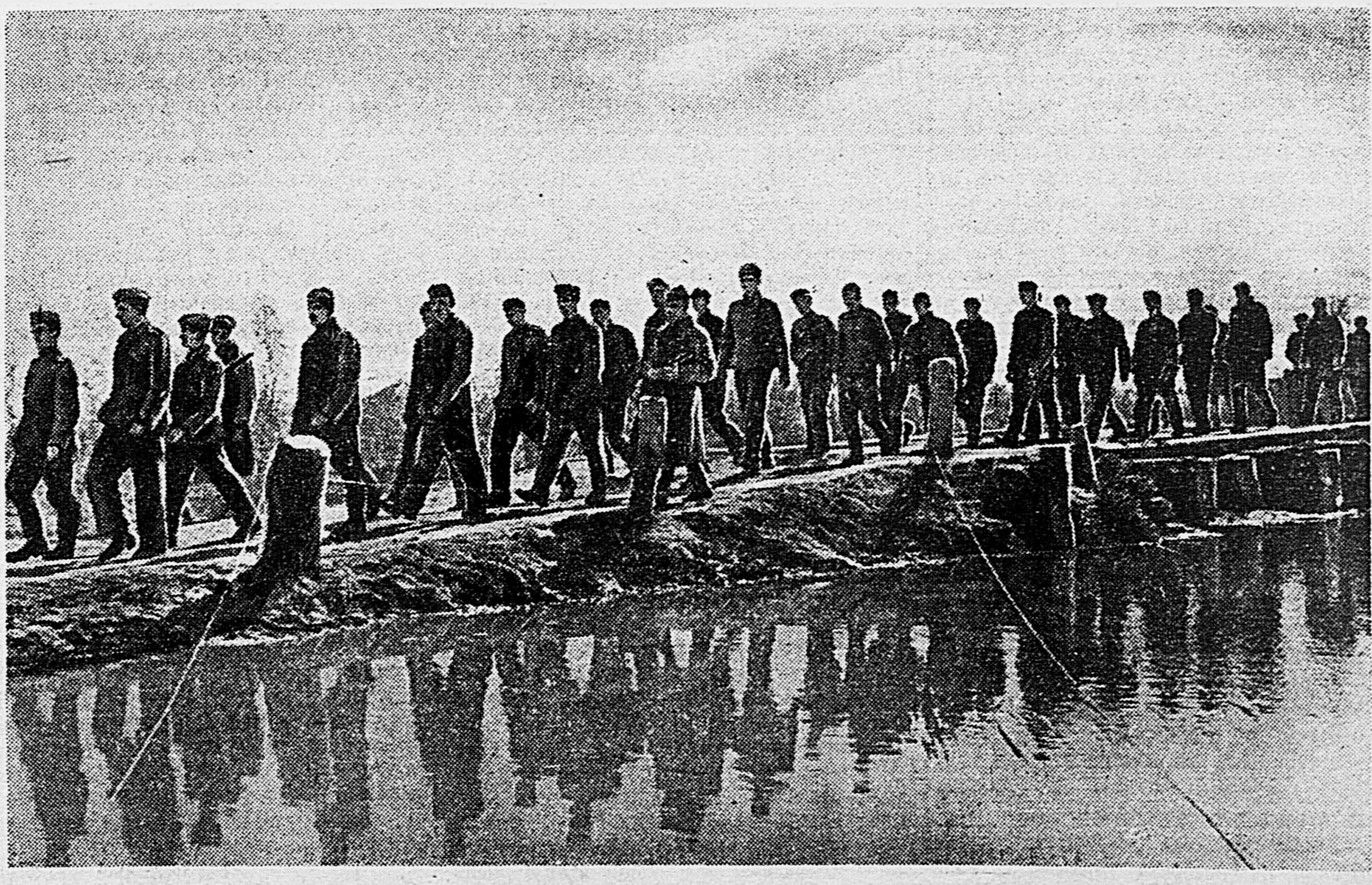
ПОД СТАЛИНГРАДОМ. Группа пленных немецких солдат, захваченных нашими частями. Снимок С. Альберина.

В районе юго-восточнее Новороссовки также отбит ряд атак противника. Наши части на каждую из них отвечали успешной контратакой.