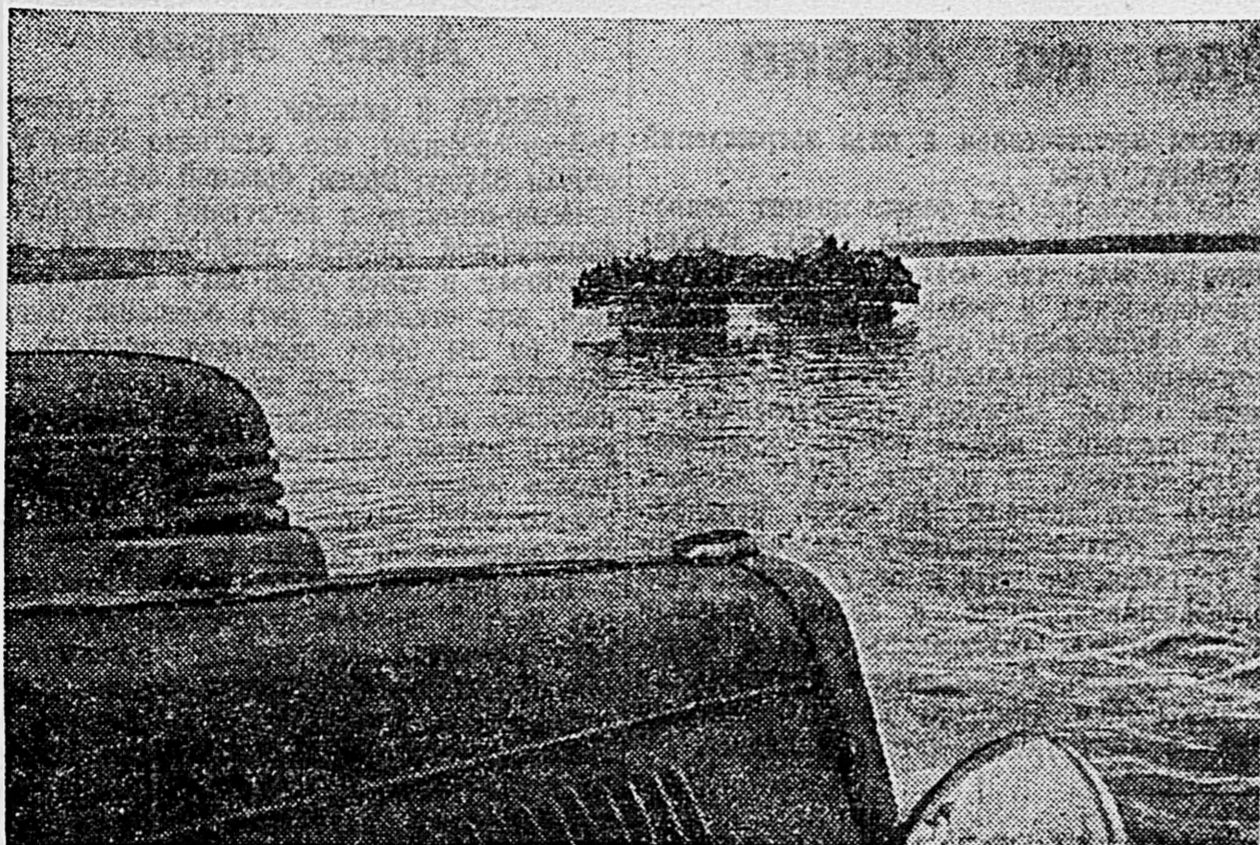
В СТАЛИНГРАДЕ. На переднем плане — снимок нашего спец. фотокорр. А. Калустянского.