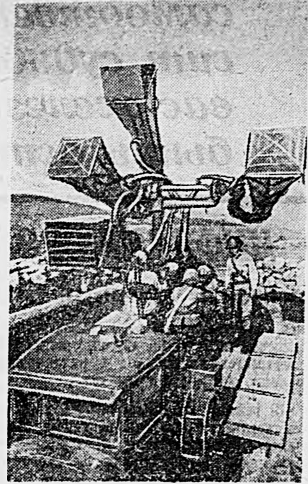
НА СЕВЕРНОМ КAVKAZE. Звукотехники работают.

Старший батальонный комиссар Л. ВЫСОКОСТРОВСКИЙ.