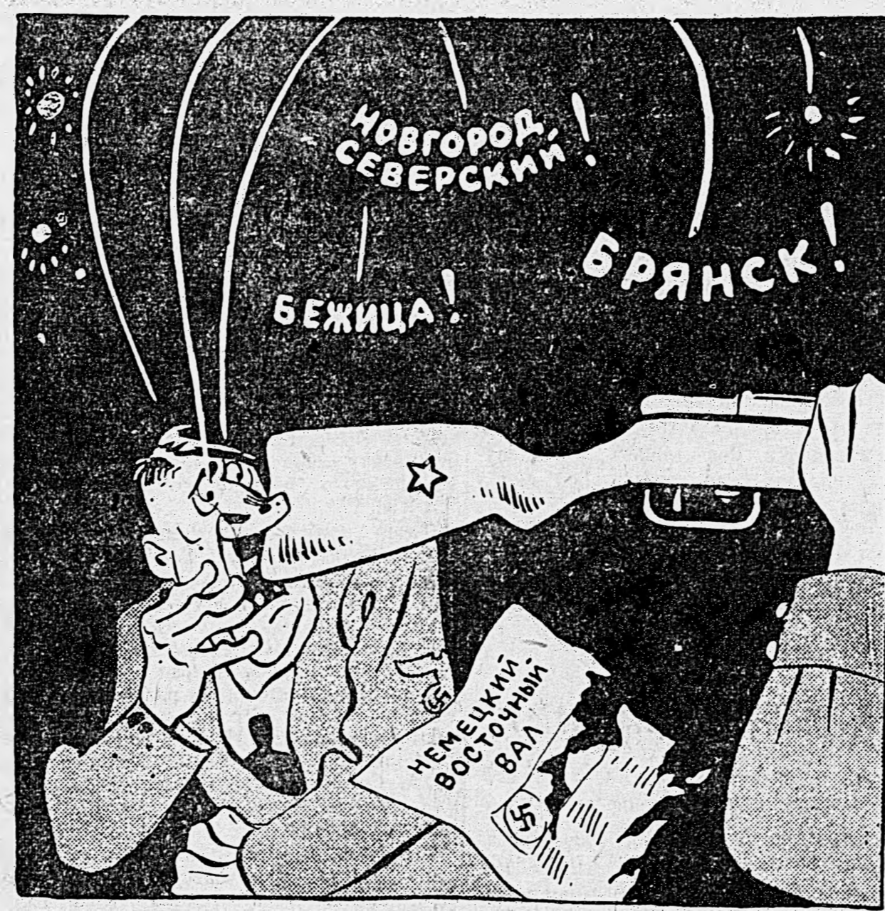
Рис. Бор Ефимова.