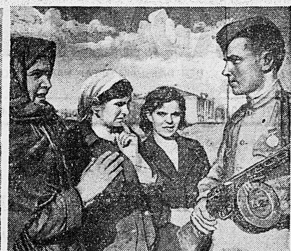
В НОВОРОССИЙСКЕ. На снимках: 1. Командир 11-й Новороссийской штурмовой авиационной дивизии Герой Советского Союза подполковник Губрий. 2. Разрушенный немцами Новороссийский порт. 3. Боец беседует с жителями заводского поселка.