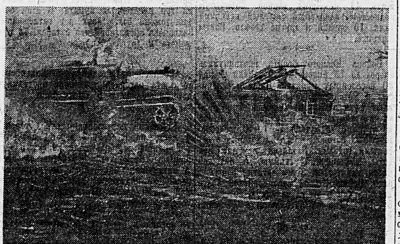
ЦЕНТРАЛЬНЫЙ ФРОНТ. Танки соединения генерал-лейтенанта Черняховского ведут бой за населенный пункт.