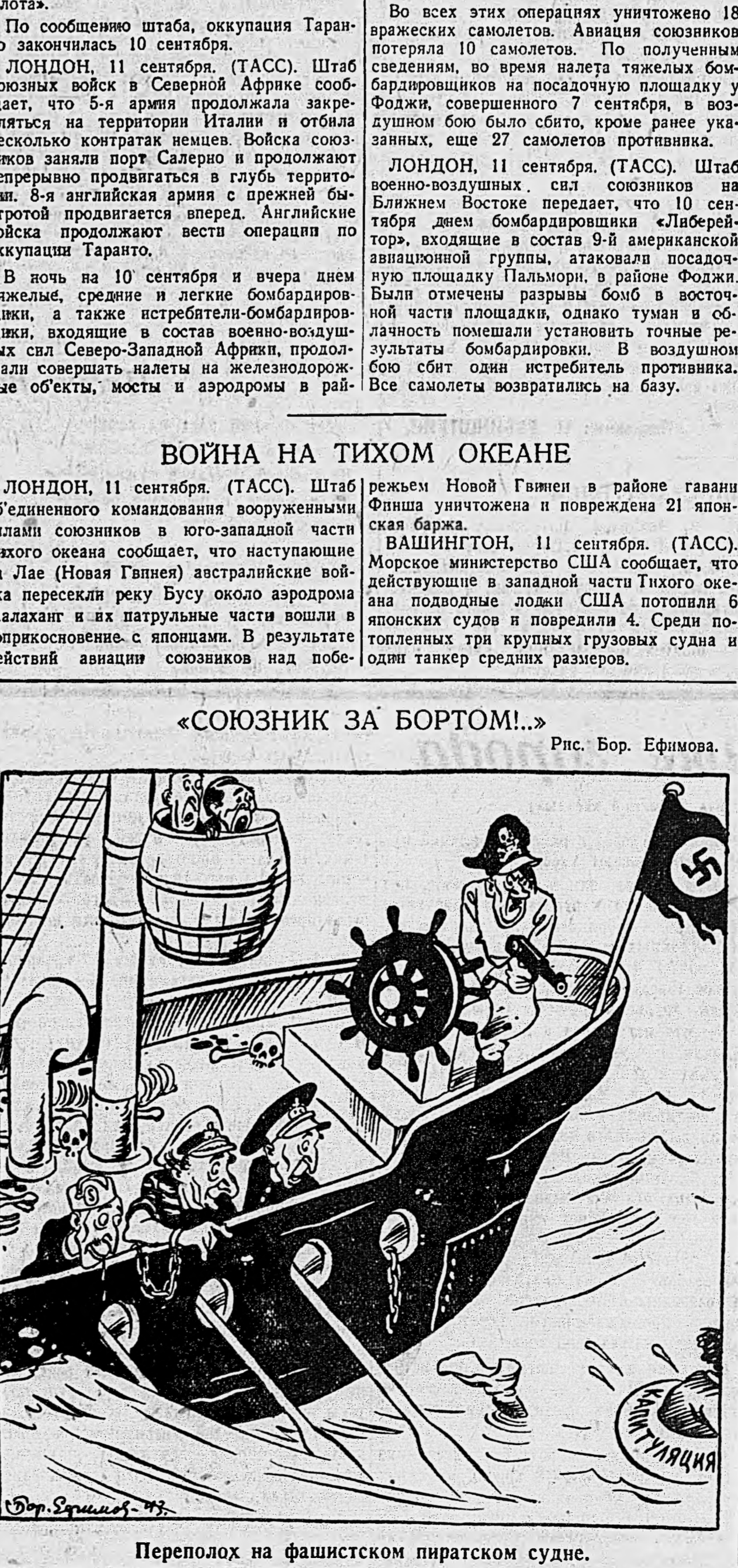
Переполох на фашистском пиратском судне.