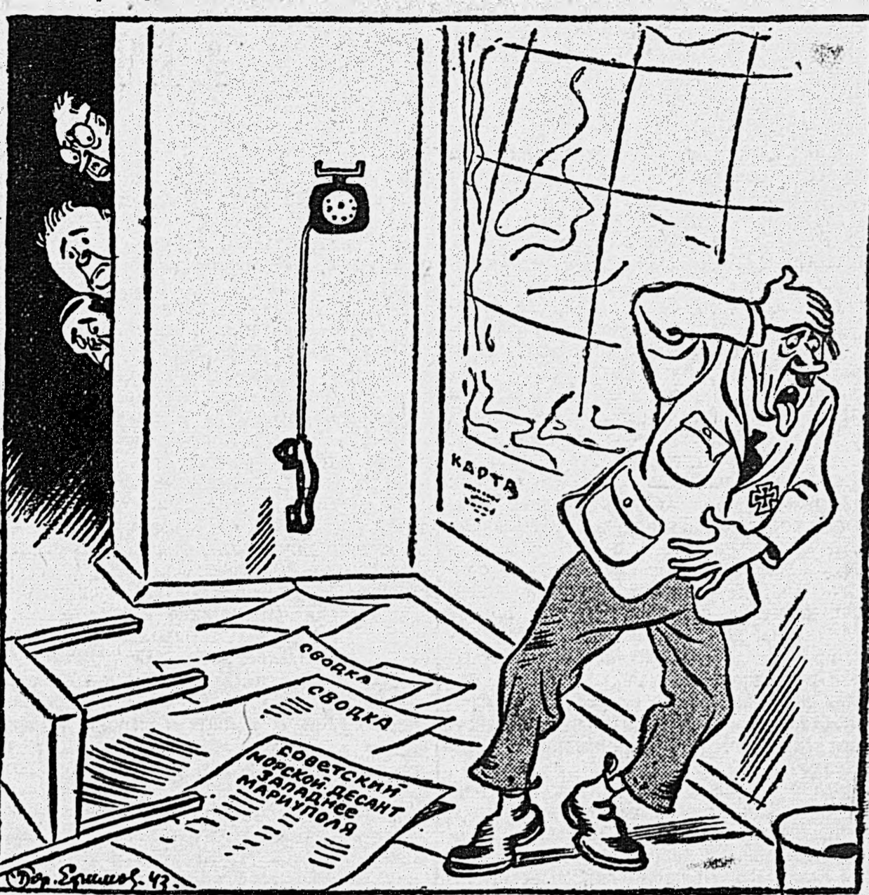
В связи с взятием советскими войсками Мариуполя, у фюрера сильнейшая Волноваха...