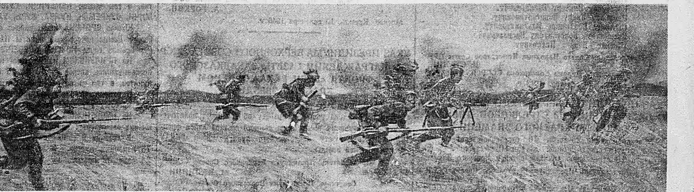
ЮГО-ЗАПАДНЫЙ ФРОНТ. Подразделение гвардии лейтенанта Румянцева выбивает противника с занимаемых им позиций.