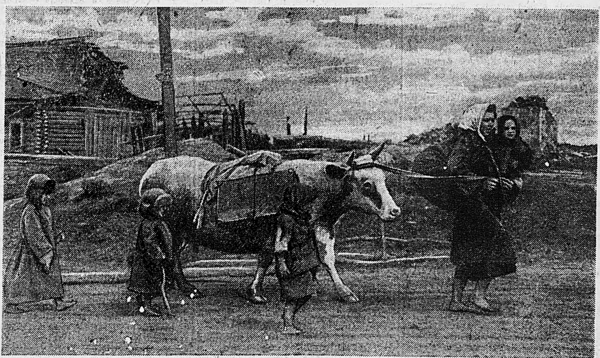
ЮЖНЕЕ БРЯНСКА. Жители возвращаются в освобожденные Красной Армией родные села.

Майор Т. ЛИЛЬИН. к. АРТЕМОВСК. (По телеграфу).