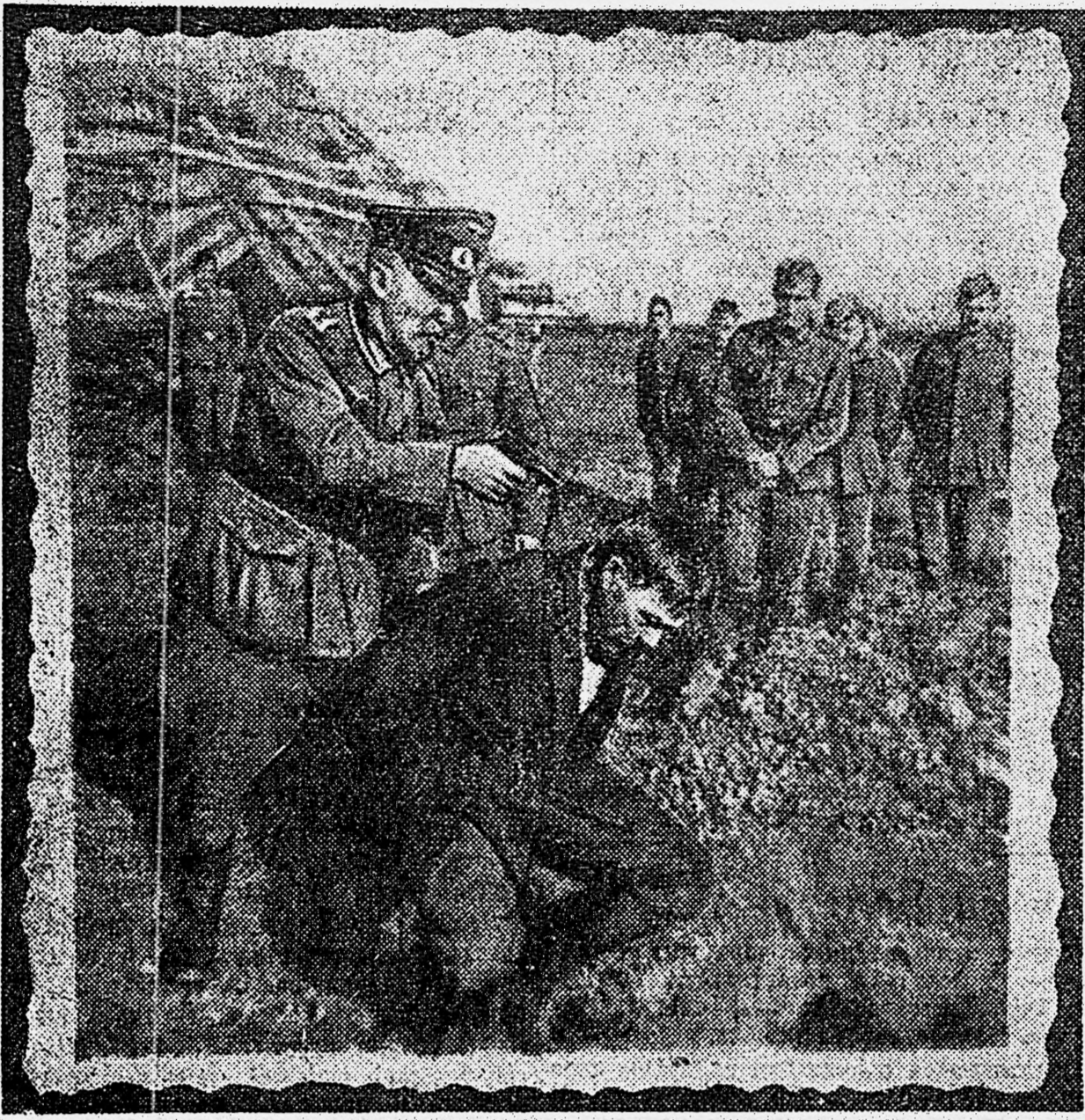
Эти снимки, опубликованные в газете «За Родину» Северо-Западного фронта, найдены у взятых в плен немецкого солдата Людвиге, служившего в одной из караульных частей 16-й немецкой армии. Фотографии лежали в бумажнике у немца, и, надо полагать, он с удовольствием показывал их своим собратьям по работе и разбою. На снимках изображены, как гестаповцы расстреливают советских людей. Вы видите обыкновенных рядовых русских крестьян, им связали руки, поставили на колени перед ямой и немецкие палачи готовятся пустить им пулю в затылок. Коротконогий