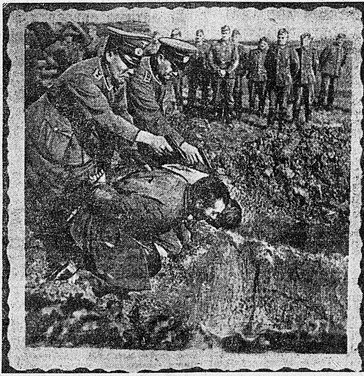
немецкий фельдфебель вместе со своими подручными творит эту страшную расправу. Фельдфебель готовится застрелить беззащитных людей. Он спокоен, этот фашист, эта бесчеловечная немецкая собака! Для него расправа — дело привычное. Вокруг стоят немецкие солдаты, с явным удовольствием созерцающие казни. Они стоят в невозмутимых позах. Одни — заложив руки за спину, другие — улыбаясь. Эти снимки, произведенные немецким фотолюбом, как нельзя лучше характеризуют немецкую