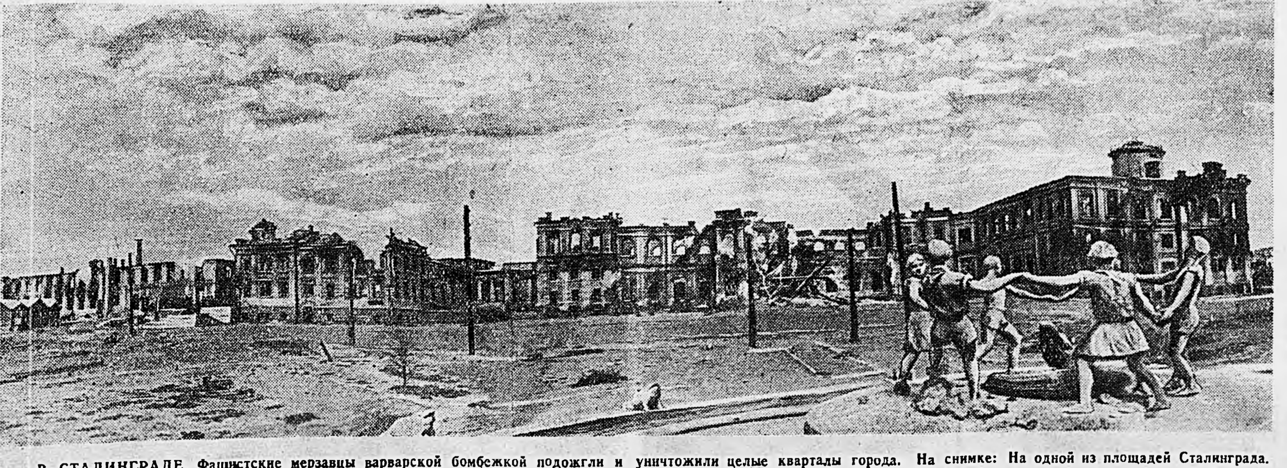
В СТАЛИНГРАДЕ. Фашистские мерзавцы варварской бомбежки подожгли и уничтожили начало квартала города. На снимке: На одной из площадей Сталинграда.