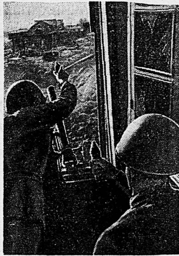
В РАЙОНЕ СТАЛИНГРАДА. Бой в населенном пункте. Мномочисленны ведут огонь по противнику из дома.