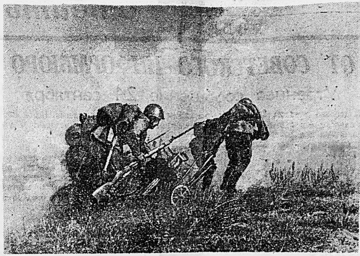
В РАЙОНЕ СТАЛИНГРАДА. Пулеметный расчет меняет позицию под прикрытием дымовой завесы.