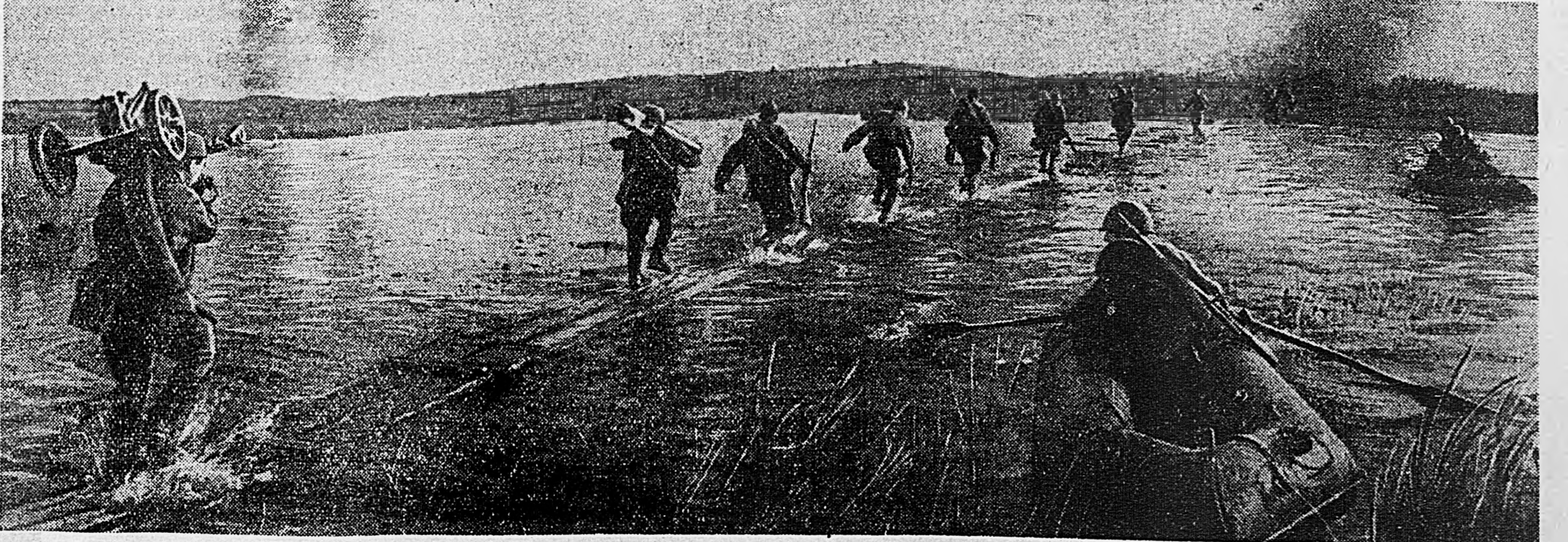
ЮЖНЕЕ ВОРОНЕЖА. Бойцы N части переправляются через реку.

сти освободили от немцев еще один населенный пункт, имеющий важное тактическое значение. В бою с врагом особенно отличились два подразделения. Действуя дружно и решительно, бойцы этих подразделений быстро сломали сопротивление врага, сбив его с занимаемых им рубежей и заставили в беспорядке отступать. Упорство и наступательный порыв этих подразделений во многом обеспечили успех советских. В течение почти на 16 сентября наши части предприняли новые атаки на позиции противника и опять нанесли его войскам чувствительный удар.