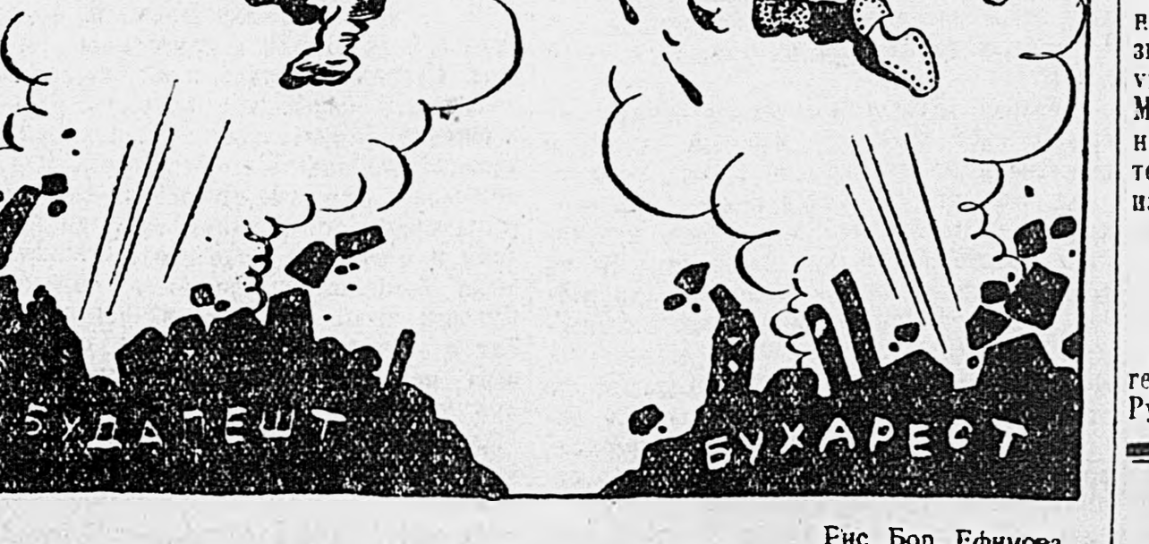
Рис. Бор. Ефимова.