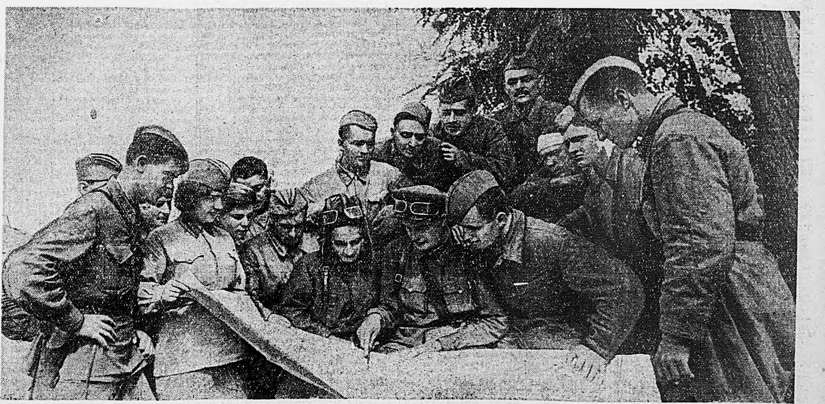
НА СЕВЕРНОМ КАВКАЗЕ. В районе Моздок, группа бойцов и командиров двух бронепоездов, уничтожившая в одном бою 18 вражеских танков.

На другом участке наши части вчера утром начали активные действия. Противник оказал им сильное сопротивление, бросив в контратаку танки. Одна часть была в течение часа контратакована несколько раз с четырех направлений, причем немцы ввели в бой в общей сложности 69 танков. Часть выдержала натиск врага, успешно отразила все его контратаки и причинила ему немалый урон. Наши войска продолжают продвигаться вперед на этом участке. Противник выбит из двух населенных пунктов.